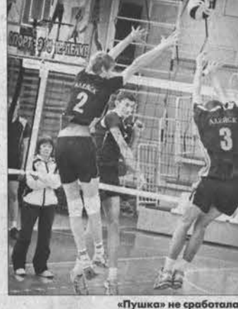
«Пушка» не работала.