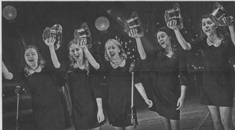
Образцовый коллектив Алтайского края – вокальный ансамбль «Журавушки» (г. Заринск).