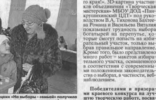
Фоторабота Марины Кальнищих «На выборы - семье» получила диплом I степени.