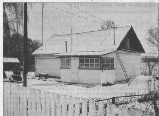
На дворе белым-бело, а в доме - тепло.