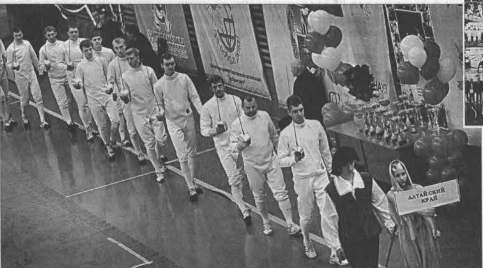
Хозяева вышли по-настоящему заряженными на победу.