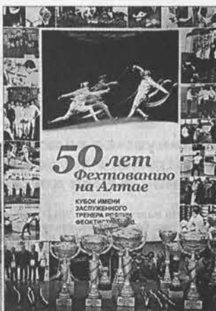
В этом виде спорта у нас немало спортивных достижений