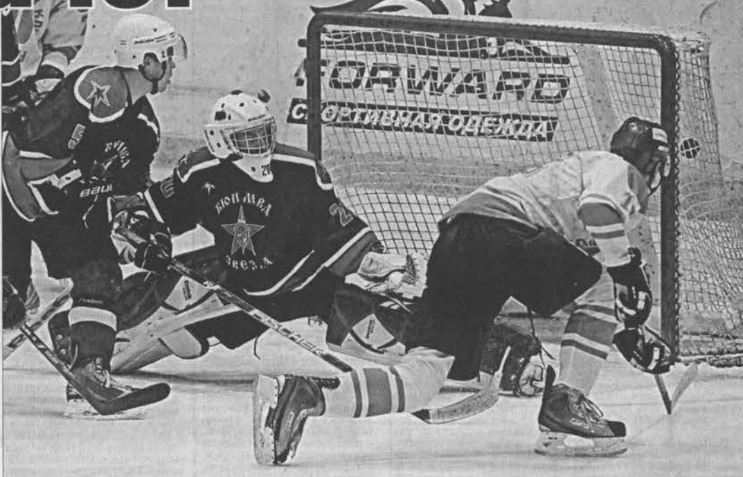
В матче-открытии гости были неудержимы.

дил уже по другому сценарию. Хозяева «отрулили» в ворота соперников семь шайб, пропустив лишь две, взяв убедительный реванш за поражение днём ранее. Шайбы в ворота соперников забивали студенты БЮИ, АГАУ и АЛПТУ. Календарь игр составлен таким образом, что студенты играют каждые выходные, чередуя матчи дома и на выезде. Второй тур сборной вузов края, которая тренируется на хоккейной ко-