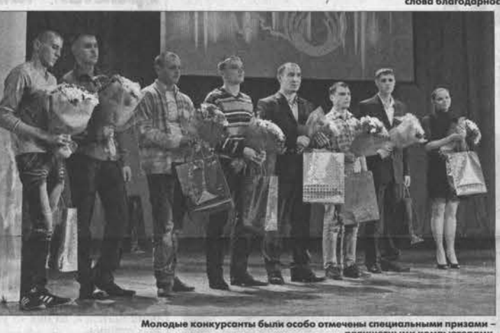
Молодые конкурсанты были особо отмечены специальными призами — планшетными компьютерами.

— Я искренне рад приветствовать в этом зале представителей трех поколений славной когорты создателей, — сказал губернатор. — У нас стало доброй традицией каждый год проводить соревнования среди лучших представителей профессий. Алтай славен рабочими — виртуозами своего дела. Их труд по праву вызывает у нас и восхищение, и гордость. Согласитесь, что наше общество только