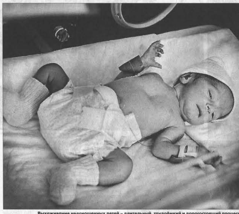
Выхаживание недоношенных детей — длительный, трудный и дорогостоящий процесс.

На краевом уровне для помощи новорожденным детям с проблемами здоровья (в том числе и недоношенным) создана трехуровневая система оказания помощи. Первый уровень — центральные районные больницы, второй — межрайонные перинатальные центры, которых у нас в крае шесть — в Славгороде, Бийске, Рубцовске, Алейске,