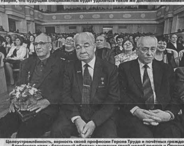
Целеустремленность, верность своей профессии Героя Труда и почетных граждан Алтайского края — бесценный образец служения своей малой родине и Отчизне.