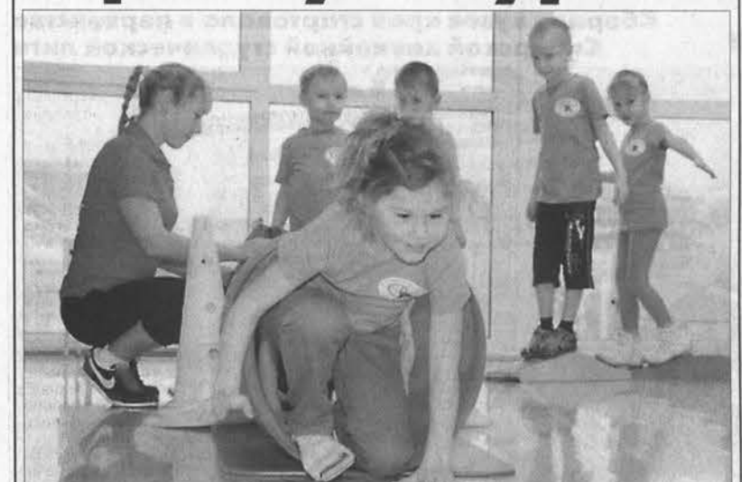
Дети с диабетом вполне спортивные.

Диаспартакиада проведена в столице края во Всемирный день борьбы с диабетом. Участниками спортивного праздника стали 50 ребятшек, больных диабетом.