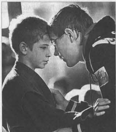
Поверь в клубе, сынок.

Где ещё, как не на Алтае, ковать будущим чемпионам самбо? Только задумайтесь: такой турнир, как открытое первенство Барнаула, собрал 127 участников не только из краевого центра, но и Бийска, Заринска, Рубцовска, Славгорода, Алейска, Тальменки, Шипуново, Мамонтово. Прибыли даже гости из Прокопьевска Кемеровской области.