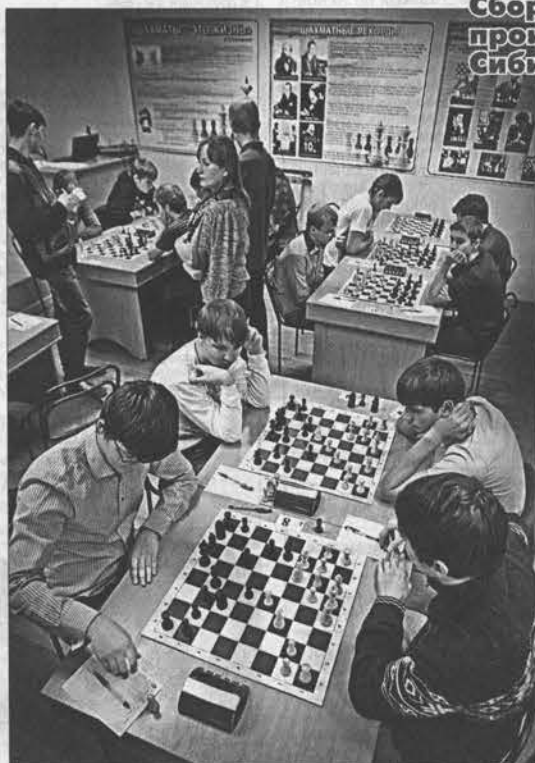
Участники сражались в уютной обстановке.

Сборная края по шахматам произвела фурор на первенстве Сибирского федерального округа