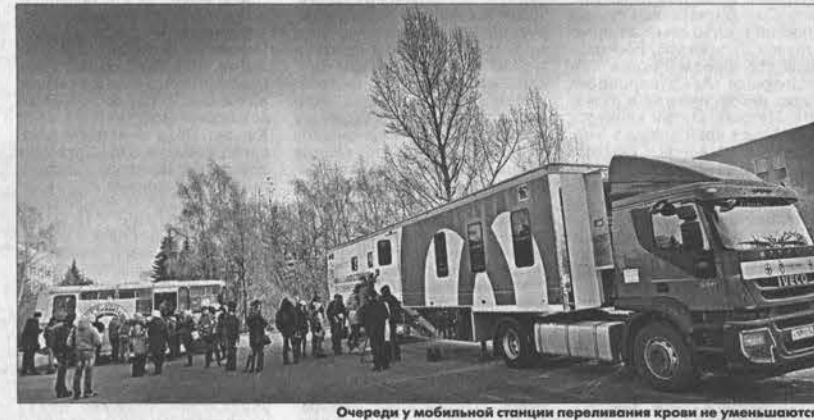
Очереди у мобильной станции переливания крови не уменьшаются.

Кстати В сентябре студенты-социологи из Алтайского государственного университета тоже участвовали в подобном проекте и поддержали Всероссийскую донорскую акцию «Энергия жизни». Тогда десятки людей пришли на городскую станцию переливания крови, чтобы протянуть руку помощи больным детям и взрослым. Волонтеры давали необходимую консультацию, а после процедуры вручали каждому участнику небольшие подарки – кружки с символикой акции.