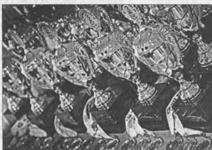
Кубки и медали - победителям и призерам.