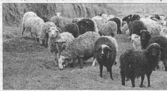
Овечек в хозяйстве целых 200 голов.

О перипетиях первых лет фермерства супругам вспоминать особенно некогда: насыщенных каждодневных забот хоть отбавляй, к примеру, оформление очередного кредита. Столько бумаг, визитов в разные службы и не только в райцентре! Но трудностей тогда было в достат-