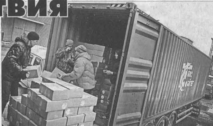
В эту фуру вошло 2900 посылок.