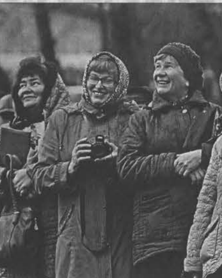
Жители Тогулы очень ждали открытия нового медицинского учреждения.