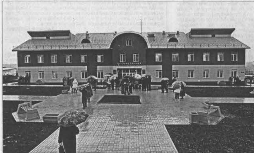
На строительство объекта было потрачено почти 70 млн. рублей.