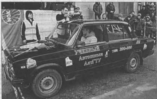
Участники украсили технику плакатами.

Рёв моторов попеременно с весёлой музыкой доносился с автодрома в минувшую пятницу. Складывалось впечатление, что меряются силами как минимум внедорожники. На деле, конечно, всё было гораздо скромнее: за первое место боролись «семёрки» и «шестёрки». Однако и с такой техникой можно произвести настоящий фурор.