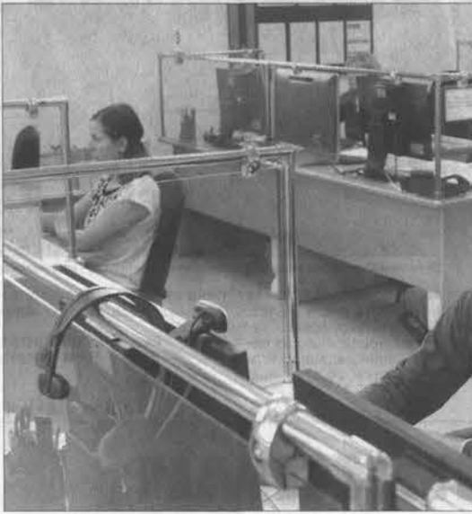
Центр управления в кризисных ситуациях работает круглые сутки.

Парк техники требует постоянного обновления. В текущем году мы поставили на вооружение две цистерны тяжелого