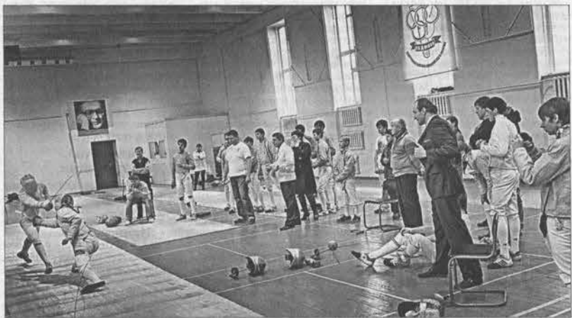
В новом зале — четыре фехтовальные дорожки.