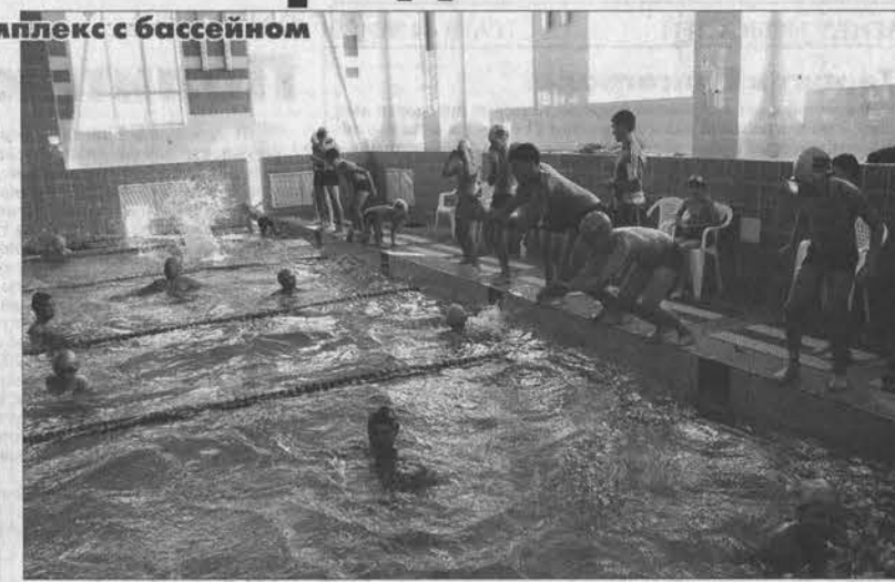
Воспитанники каменисткого спортклуба «Боец» в восторге от таких необычных тренировок!

группах, где обучаются плаванию дети от семи до десяти лет. Хотим научить ребятшек держаться на воде, чтобы летом было меньше трагедий в открытых водоемах. Дети старших возрастов занимаются в платных группах. Будем в Камне растить пловцов-профессионалов!