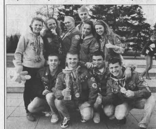
Наша сборная по черлидингу оказалась лучшей на Всероссийской спартакиаде.

Алтайский краевой штаб студенческих отрядов признан лучшим в стране. С такой замечательной новостью вчера вернулись наши бойцы из города Сочи, где с 18 по 21 октября проходили Всероссийский студенческий слёт и спартакиада.