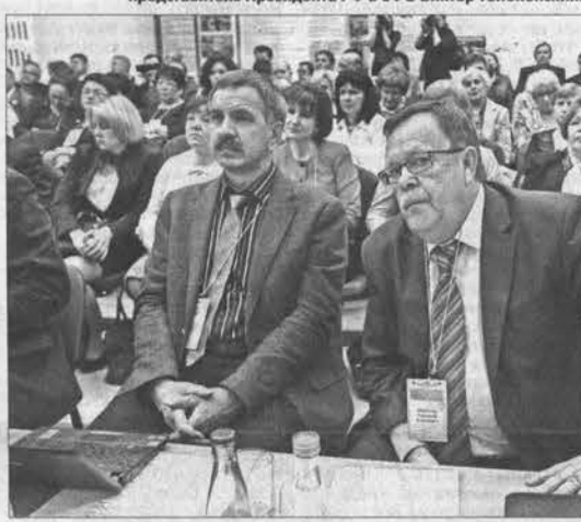
Представители трех округов обсудили самые важные вопросы здравоохранения.