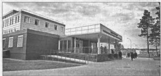
Федеральный центр травматологии, ортопедии и эндопротезирования.

Выбор региона для проведения такого большого мероприятия был не случаен. «Дорожная карта» на сегодняшний день реализуется в регионах России, в том числе в нашем крае. Более того, достигнутые результаты в этой области и послужили причиной выбора места для проведения большого совещания.