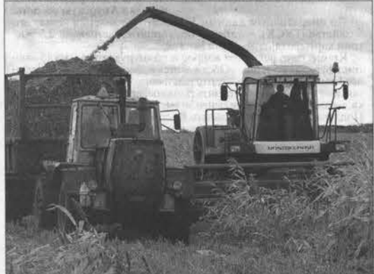
Запас, как известно, карман не тает, поэтому заготовке кормов уделяется особое внимание.

ренки, которых успели спасти, были отправлены в спешном порядке в Ключевский район. Немаленький коллектив жизни воткнуло в землю и без работы, и без зарплат. Жизнь в селе если и не остановилась, то замерла в тревожном предчувствии: а дальше-то что?