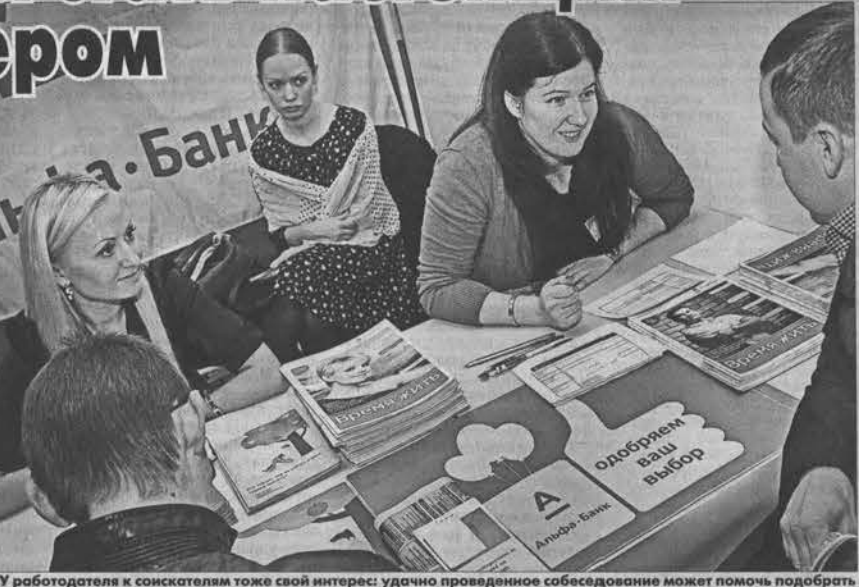
У работодателя к соискателям тоже свой интерес: удачно проведенное собеседование может помочь подобрать хорошего сотрудника.

В числе традиционных участников ярмарки - ОАО «Алтайский завод агрегатов». Он представил широкий ряд вакансий - от