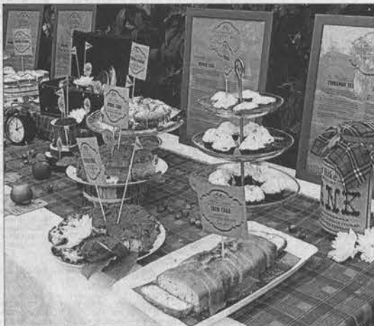
Английский пикник, приготовленный «настоящими» леди.