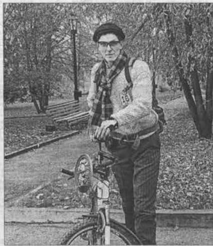
Этот джентельмен прибыл из Новосибирска.