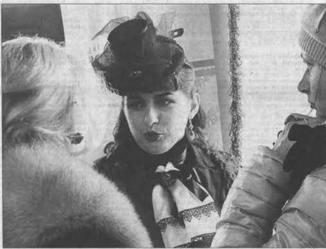
Почти как на картине Крамского.

Джентльменам в твидовых пиджаках, шерстяных свитерах, кепи, шляпках, заматанных в клетчатые шарфы, было проще не ежиться на холодном ветру. Конечно, выглядели они весьма элегантно. А некоторые обради-