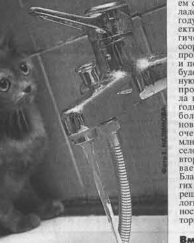
Что дороже: вода или деньги?