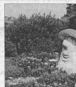
Этот гриб Степашка был подарен жителям микрорайона администрацией города.