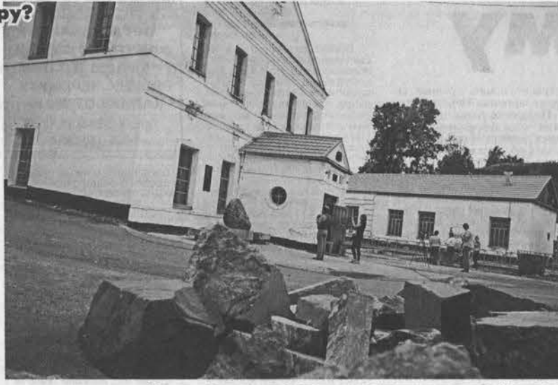
Кольманьский камерный завод: здесь рождалась знаменитая «Царица ваз».