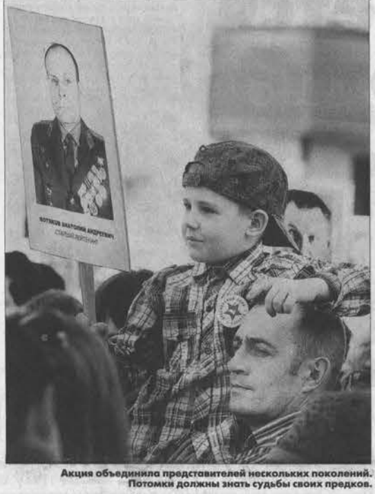
Акция объединила представителей нескольких поколений. Потомки должны знать судьбы своих предков.