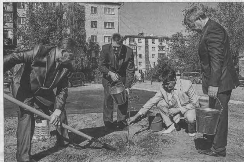
Начало «сказочной» аллеи.