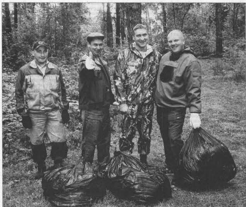
Борнаульские лесники быстро загрузили целый «КамАЗ» и продолжили уборку.

Накануне профессионального праздника, Дня работников леса, специалисты отрасли сделали, без преувеличения, сенсационное заявление: каждую третью пятницу месяца они вынуждены очищать лесные массивы от мусора и высаживать деревья.