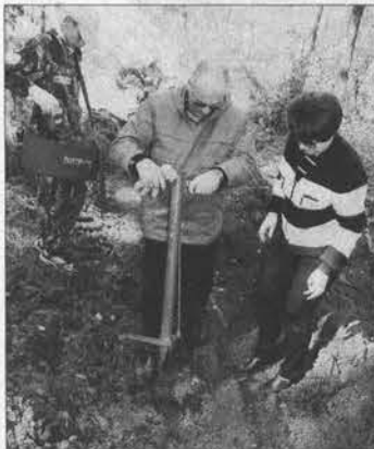
Бобровское лесничество. Идет посадка сеянцев сосны с закрытой корневой системой на месте, очищенном от мусора.

участок вдоль Змеиногорского тракта. Привели в порядок 3 гектара. Без лопат и мешков было не обойтись. Привлекли тяжелую артиллерию: «КамАЗ» и трактор. – Что вы здесь делаете? – с таким вопросом подошла к лесникам пожилая горожанка. Она никак не могла поверить, что в суботный день кому-то есть дело до леса. – Молодцы, ребята! Так держать! Лесники заверили женщину почтенных лет, что останавиваться не собираются. Вдохновленные первыми успехами, они снова выйдут на уборку уже через месяц – 18 октября.