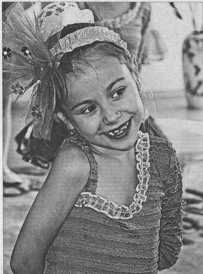
Юная артистка из детского сада «Ярловская».