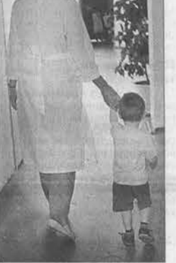
Чтобы уйти из дома ребенка в семью, малыши а больницах случаев должен быть здоровым.

Нами проведена большая работа совместно с кардиологами научно-исследовательских институтов Томска и Новосибирска, где за 6 лет было прооперировано 16 детей. Впоследствии 13 из них приобрели сердце. Двое других – дети с синдромом Дауна. Прооперировав их сердца, мы дали возможность быть им более здоровыми, получить необходимый запас жизненной энергии. В итоге эти дети стали развиваться гораздо лучше и сейчас находятся не в специализированных детских учреждениях, а в обычных детских домах, а это очень важно. Кроме того, есть у нас опытные работники и с врожденными патоло-