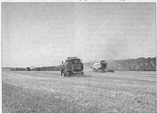
Идёт обмолот на ячменном поле ОАО «Антипинское».