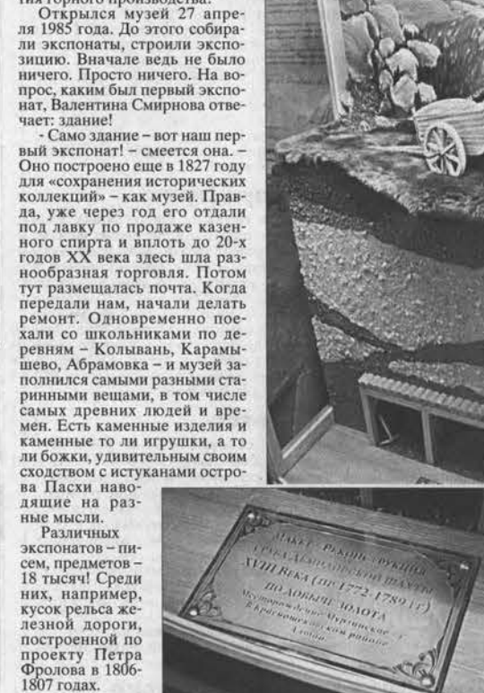
Макет сруба шахты на Мурашинском руднике - подарок музею губернатора Александра Карлина.