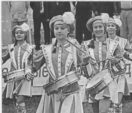
Боробонная дробь в честь события.

е с братом занимали. Но борьба есть борьба, и побеждает сильнейший. Для меня это тоже полезный опыт. Когда все уже на уровне моторики, видишь что-то новое для себя и начинаешь применять в своей работе. А объясняет профессионалу тонкости работы на грейдере, наверное, и не смогу. В командном зачете среди дорожных организаций победителем стало ООО «Барнаульское ДСУ-4». Давно принято говорить, что в соревновании главное не победа, а участие. На мой взгляд, эта фраза права лишь отчасти. Ведь дух состязательности и желание победы — хорошие стимулы на будущее. И те, кто нынче не занял первых мест, уезжали с приятным желанием победить в буду-