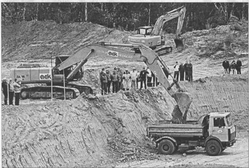
На новом экскаваторе и грузить легче.

(Начало на 1 стр.) Школа профессионального мастера — это не только передача опыта, но и возможность познакомиться с новой техникой. И она — китайского, японского и российского производства — была достаточно широко представлена здесь. Более того, лидеры предложили дорожникам проводить соревнования именно на ней. Естественно, это добавило участникам определенной сложности: ведь одно дело — сидеть за рычагами, скажем, хорошо знакомого бульдозера и совсем другое — управлять новинкой, только что сошедшей с заводского конвейера. Но, согласитесь, на то он и профессионал, чтобы быстро разобрались с рычагами и педалями, качественно выполнить поставленную задачу.