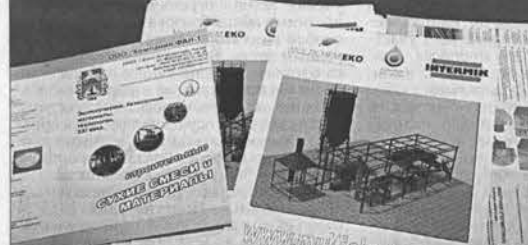
Польская сторона представила свои проекты в виде красочных буклетов.

жет уходить до половины всех доходов. Однако в республике налажена эффективная система субсидий, тарифов, кредитов и льгот для владельцев жилья, а также предприятий и организаций, работающих в коммунальном хозяйстве. Здесь активно ведется строительство дешевого социального жилья. Препятствия энергетике, водоснабжения и муниципального транспорта Польши входят в холодный, все их акции находятся в собственности муниципальных органов. В итоге мэрии управляют финансовыми ресурсами, производственной деятельностью в сфере ЖКХ и контролируют качество оказываемых услуг. Во то же время такие услуги, как уборка, вывоз мусора, обслуживание жилья, ремонт зданий — осуществляют преимущественно мелкие частные компании. Они могут пользоваться кредитами на очень выгодных условиях для расширения производства, модернизации и закупки нового оборудования. Но главную роль в ЖКХ Польши играют объединения совладельцев многоквартирных домов — аналоги российских товариществ собственников жилья. Они оплачивают все услуги (отопление, водоснабжение, электроэнергия и так далее), разбираются с неплательщиками. При этом тарифы на услуги не могут быть произвольно завышены — они утверждаются на государственном уровне. Однако даже в соседних домах тарифы могут отличаться друг от друга, поскольку здания отличаются по конструкции, материалу, возрасту и другим параметрам. Реформы ЖКХ в Польше не завершены. С 1 июля этого года наступил новый этап «мусор-