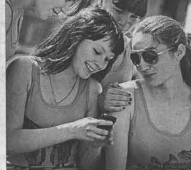
Воспитанники детского дома перед тренировкой.

– Никогда не принуждал. Наоборот, дети из детского дома сами долго меня уговаривали, чтобы я тренировал их дополнительно во внеурочное время. Есть много способов, чтобы привить детям любовь к бегу. Главное – создать условия, убедить ребят тренироваться по-настоящему, укрепить веру в себя. Рассказывал им про наших молодых, но уже знаме-