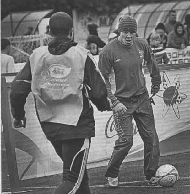
Дзюдоист любит и мяч погонять.

– В новом олимпийском цикле есть какие-то нововведе-