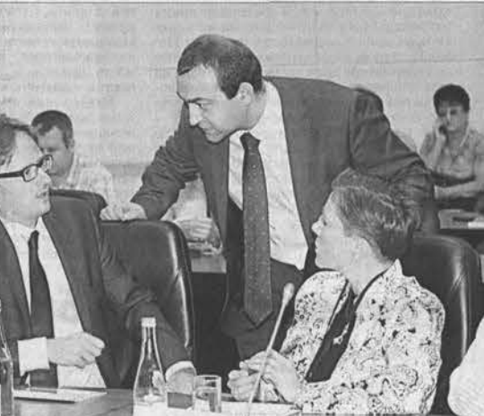
В кулуарах бизнес-презентации.