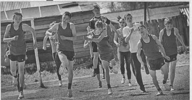
Занятие начинается с прыжковой разминки.

нитых спортсменов Шубенкова, Аплачкина. И после того, как они полюбили бегать, работа пошла.