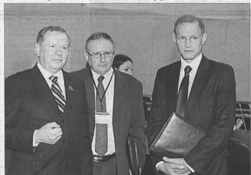
Председатель АКЭС Иван Лоор, генеральный консул Республики Польша в Иркутске Марек Зелинский и Чрезвычайный и Полномочный Посол Польши в России Войцех Заяйчковский.