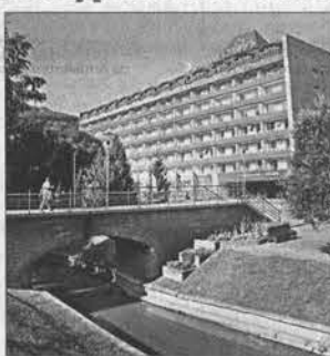
Форум проходил в конференц-зале белокурихинского санатория «Сибирь».