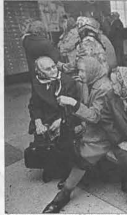
В ожидании пенсии. 90-е годы. Одна из работ классика фотографии Виктора Садчикова.

тема. И мы рады тому, что в нашем архиве сформированы два новых больших – около 9 тысяч единиц хранения – фонда, составленных из снимков Виктора Садчикова, долгое время работавшего собственным корреспондентом ИТАР-ТАСС по Алтайскому краю, и Бори-