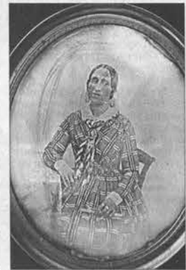
Дагеротип – картинка на серебряной пластинке. Этому портрету около 170 лет.

Дагеротипы изобретены французом Луи Жаком Дагером в 1839 году. В том же году был применен термин «фотография». Первый цветной фотоснимок был сделан еще в 1861 (!) году знаменитым английским физиком Максвеллом. В России перспективой фотодела одним из первых разглядел Сергей Прокудин-Горский, еще в 1898 году делавший доклады о фотографии в Императорском русском техническом обществе. Он же произвел первые в России цветные фотоснимки.