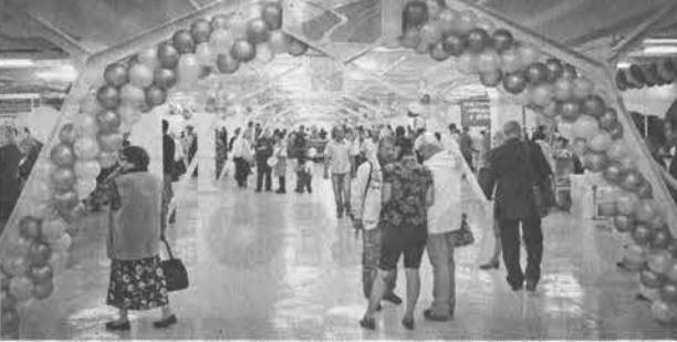
В интерьере праздника. Через несколько минут здесь будет не протолкнуться.

ем заметил московские торговые сети начали предлагать наш сыр с указанием места происхождения. Это очень важно. И меня приятно удивило, что произведенный на Алтае сыр покупает берет более охотно, хоть он и стоит дороже.