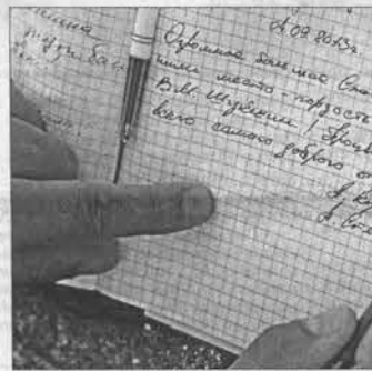
В музее лауреаты оставили несколько теплых слов в Книге отзывов.

На импровизированной сцене возле школы осужденные представили несколько вокальных номеров: от классики до рэпа (впервые в истории конкурса). Под ритмичный речитивал молодого преступника особенно оживились, стали аплодировать. После каждого выступления в обязательном порядке конкурсанты говорили напутственные слова сво-