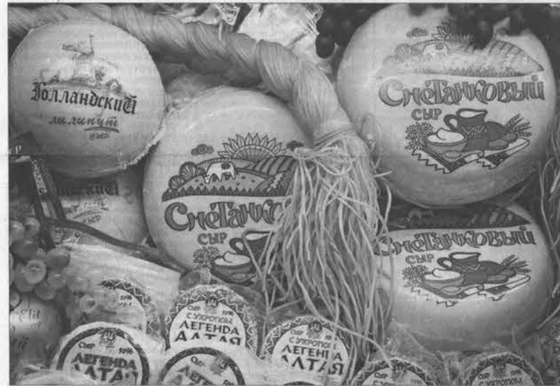
Сырная коса до пося.