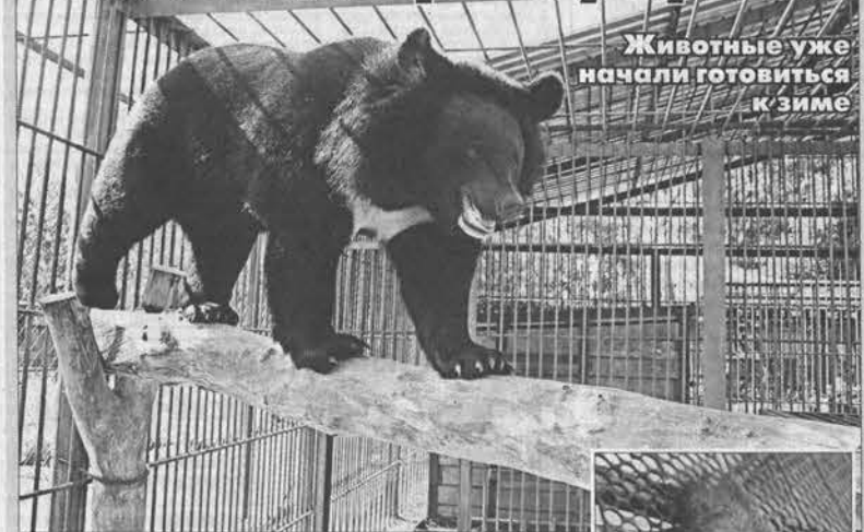
Животные уже начали готовиться к зиме

Медведь совсем скоро пойдет на боковую, т. е. впадет в спячку.