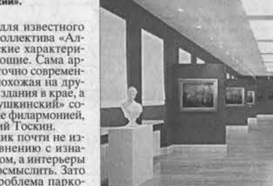
Заново построенное здание Художественного музея будет оснащено современным оборудованием, которое позволит поддерживать правильный температурно-влажностный режим.

дим второе дыхание двум известным коллективам, один из которых — оркестр «Сибирь» имеет серьезную историю и известен в стране и в Европе, а второй — наш перспективный ансамбль «Алтай», — сказал губернатор строителям. По его словам, проект сейчас вносится последние штрихи, а с 10 сентября строительные работы будут идти по четкому еженедельному графику. «Опыт ведения подобных работ у нас есть, на объекте собрался хороший коллектив — известный в крае архитектор, профессиональная строительная фирма с достойной репутацией».