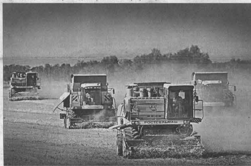
Обмолот пшеницы идет сразу пяти комбайнами.

бы перед уборкой полить гербицидом сплошного действия, убить все сорняки и молотить хлеб напрямую. Самолет-то купить можно. Он стоит два миллиона, только вот с летчиками на селе проблема. И не только с летчиками. В сельхозкооперативе нет агронома, и найти желающих не могут даже через краевую центр занятости.