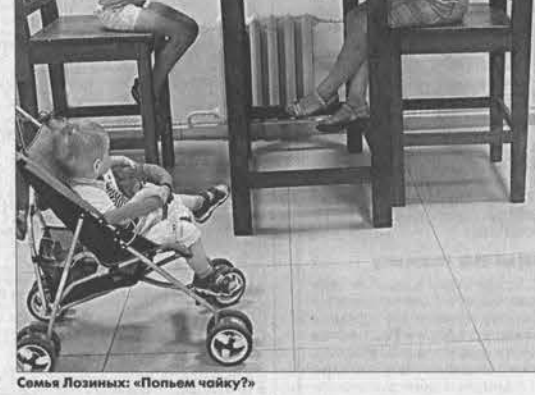
Семья Лозинки: «Пьем чайку?»

В нескольких залах разместили более пятидесяти экспонатов, большая часть из них вы-