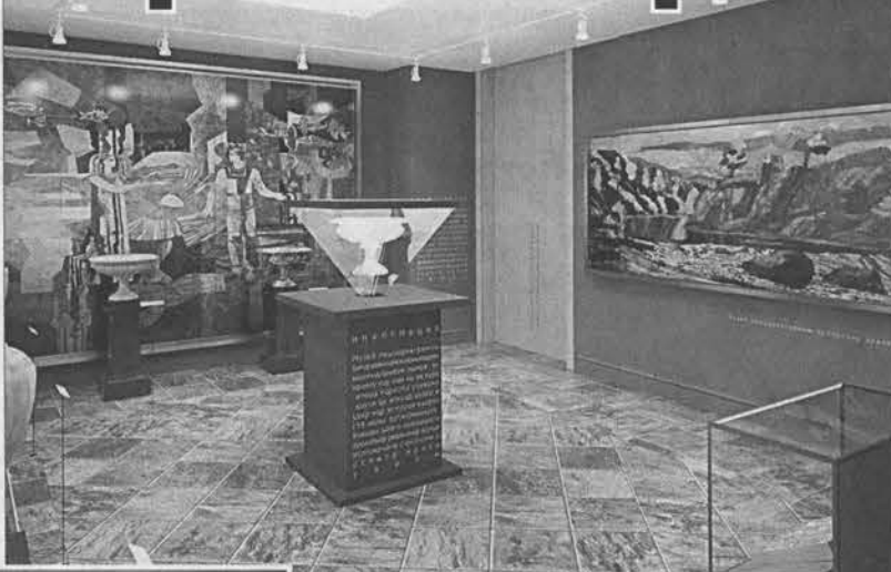
Отдельный зал в обновленном музее будет отведен истории камерного дела на Алтае.

Что касается Художественного музея, то за всю его историю, которая началась в 1958 году, он никогда не имел такой площади, которая ему была бы достоянием. Сначала он занимал небольшое помещение на пр. Ленина, 58. В 1962 году переехал в