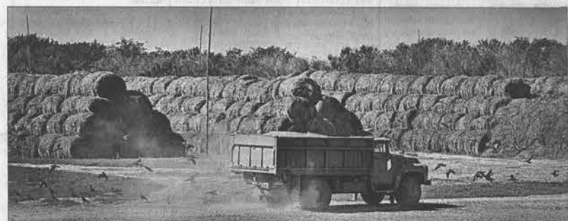
Сена в хозяйстве запасано уже на два сезона. Его заготовку прекратили, так как оно долго не хранится. Другое дело сено - подсолнечник, смешанный с суданской травой.

времена на этой площади в 15 тыс. га работало более 120 механизаторов.