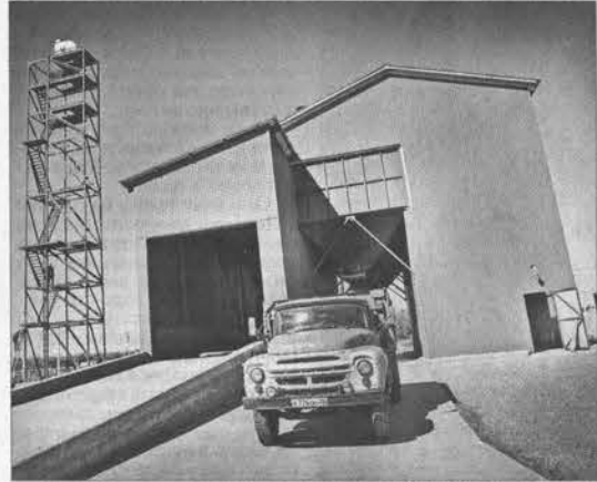
Этот зерноочистительный комплекс фирмы Schmidt-Zeeger позволяет сразу очищать все поступающее с полей зерно.

оснований для снижения цены на пшеницу нет. Электроэнергия подорожала, солярка стоит уже столько, что язык не выговаривает. Поэтому крестьяне, которые имеют «жирок», ждут, когда зерно подорожает. Именно так поступают в СПК «Знамя Родины», что позволяет работать с прибылью и не заниматься в банках. Крестьяне любят приобретать. А когда начинаешь смотреть их экономические показатели, понимаешь, что большинство работает с прибылью. Рентабельность сельского хо-