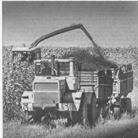
В засушливой зоне, коей является Поспелихинский район, вместо кукурузы лучше выращивать на корм скоту подсолнечник сорта Белоснежка. Он дает хорошую урожайность, содержит много сахаров, но заготавливать его надо только на цвету.

тонн. При этом важно не допустить потерь. В среднем в России сгивает 10% урожая, то есть около 9 млн. тонн зерна – два алтайских урожая.