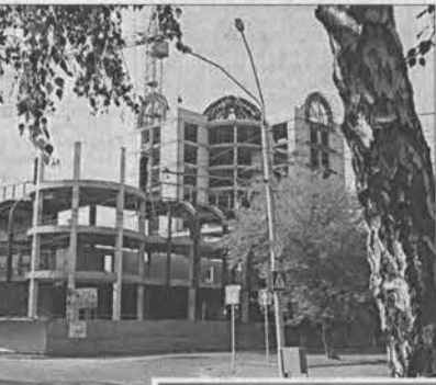
Так сейчас выглядит здание будущего культурно-делового центра «Пушкинский».