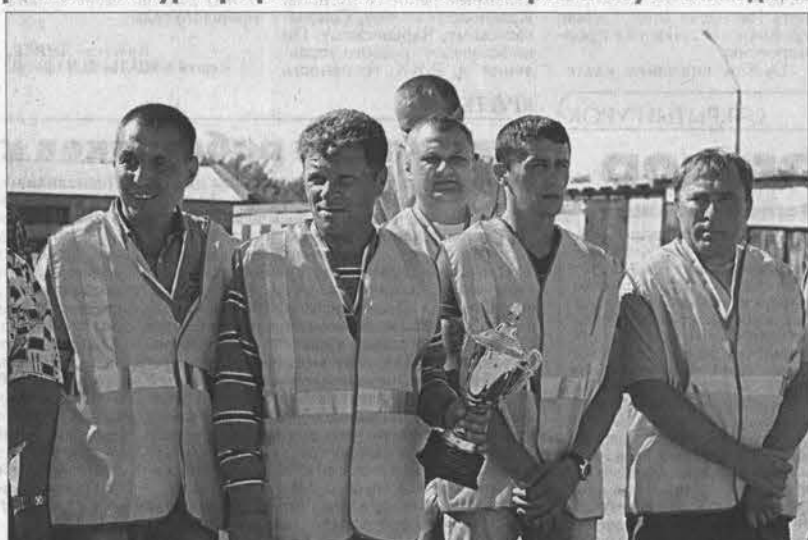
В каждом зачёте снова победили рубцовчане.