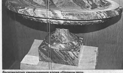
Десятикратно уменьшенная копия «Царицы ваз».

Залы музея рассказывают о том, с чего начиналось камерное дело в наших краях. Здесь — инструменты и механизмы двухвековой давности. Огромный макет показывает, как выглядела Колосальная шифонольная фабрика в годы своего расцвета, в XIX веке.