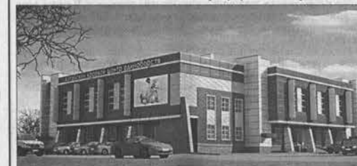
Макет будущего здания центра.

Трехэтажный спортивный комплекс для занятий дзюдо, самбо и карате будет находиться в Индустриальном районе по адресу: ул. А. Петрова, 221-ж.