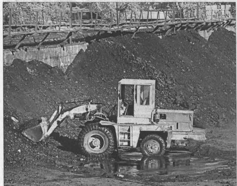
Ежедневно на склад приходят составы с углем.

Здесь уже заготовлено примерно 3 тысячи тонн угля. Этого хватит на первый месяц отопительного сезона. Железнодорожные составы с углем на городской склад приходят из Казахстана ежедневно. Топливо обходится дешевле кузбасского, но не уступает ему по качеству.