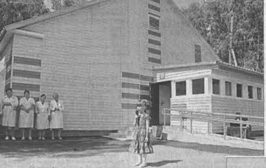
День открытия поликлиники после ремонта стал праздничным для коллектива ЦРБ и жителей Косихинского района.

В Косихинском районе после капитального ремонта открыта детская поликлиника. Она рассчитана на 50 посещений в смену, обслуживает 3,5 тысячи юных жителей района. На капитальный ремонт поликлиники было выделено 2 миллиона 400 тысяч рублей из краевого бюджета.