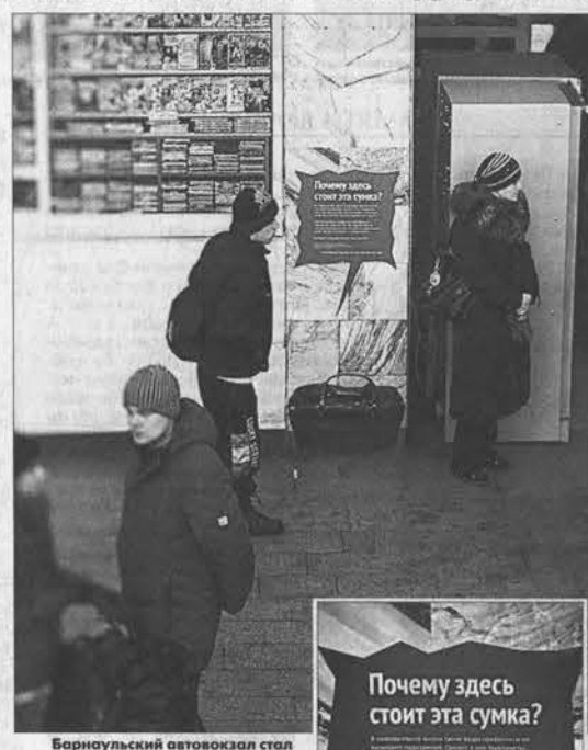
Барнаульский автовокзал стал первым местом в крае, где была размещена антитеррористическая эмблент-реклама.

Для формирования ее концепции мы привлекали местные креативное агентство PUNK YOU. За несколько лет своего существования его специалисты придумали ряд оригинальных проектов для компаний нашего региона и России, - рас-