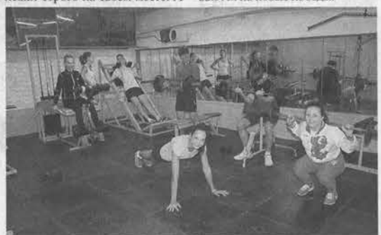
Не каждая школа может похвастаться собственным тренажерным залом