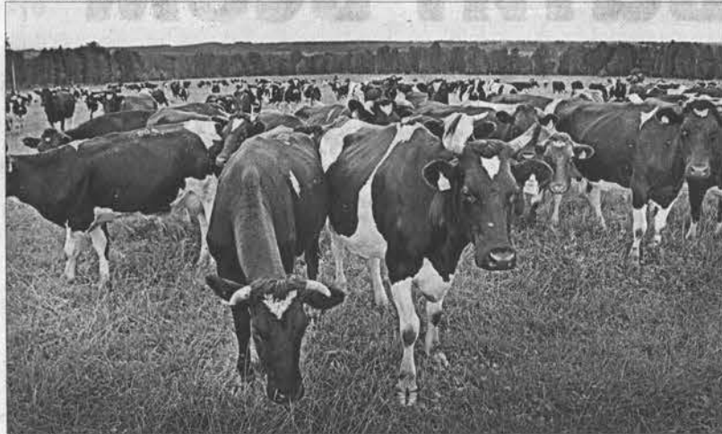
В хозяйстве насчитывается 640 коров. Все они ухоженные и сытые.

заготовке сенажа, силоса: уже сформирован запас в 100 тысяч центнеров. — Определенное напряжение, конечно, есть, — отметил губернатор. — Но вместе с тем сельхозпредприятия и фермерские хозяйства края готовы к работе в таких сложных условиях. Несмотря на то, что в последней декаде августа