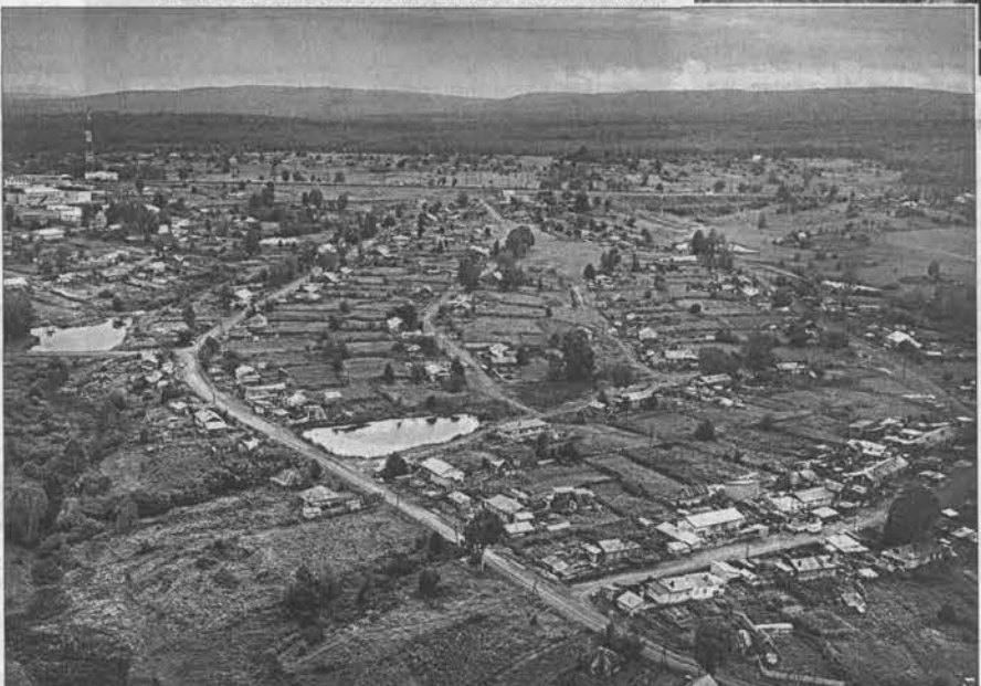
Притонное село Тягуна.