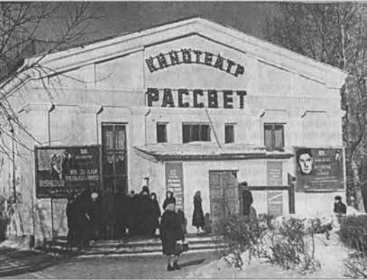
Архивные снимки свидетельствуют: в советские времена кинотеатр «Рассвет» был очень популярен.