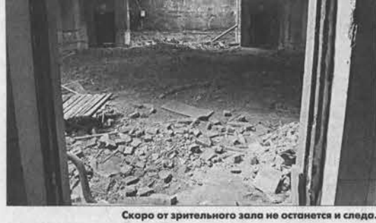
Скорот от зрительного зала не останется и следа.

не было – так или иначе приходилось ждать местной премьеры и стоять в длинной очереди за билетом.