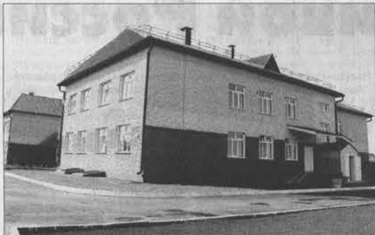
Детсад «Радуга» радует кулундинцев.