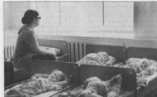
...а также ребяташки п. Заводское Троицкого района.