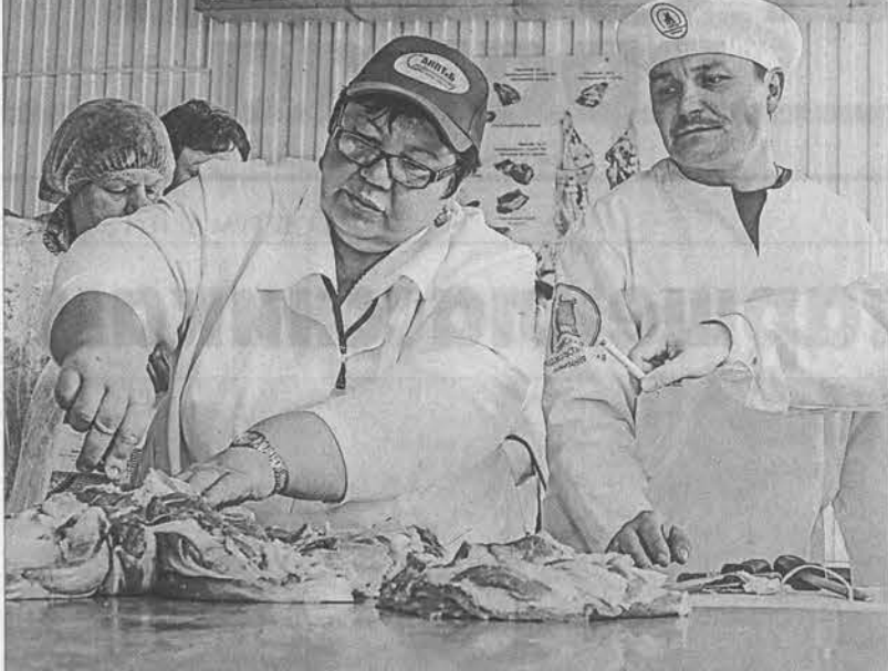
Эксперты определяли качество обвалки (отделение мяса от кости) – мясо должно быть снято цельным куском, без лишних порезов.

научиться передовым приемам работы. Я рада, что мы поддерживаем эту чудесную и правильную традицию! В испытаниях участвовали 11 специалистов. Они представляли ОАО «Восход» Каменинский мясокомбинат, ООО «Альтаир-Агро», ОАО «Рубцовский мясокомбинат», КФХ «Гончаренко», ООО «Пишепродукт «Солнечный», ООО «Брюкке», ООО «Сибирь-Агро», ООО «Заринский мясоперерабатывающий завод».