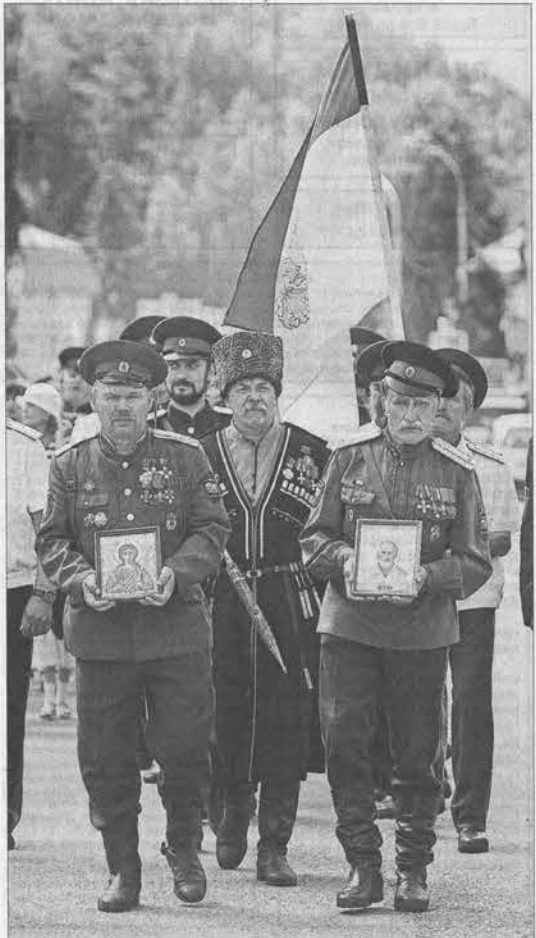
Шествие направляется на главную улицу Белокурихи.

В рамках Дня города в Белокурихе состоялся Межрегиональный фестиваль казачьей культуры. В нем приняли участие более 50 коллективов из Алтайского края, республик Казахстан и Алтай, Новосибирской, Кемеровской и Омской областей.