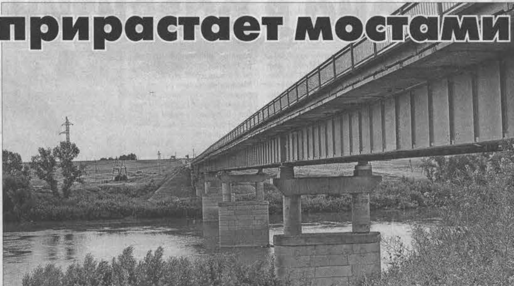
Мост через реку Чарыш.

На автодороге Алейск - Чарышское сегодня ремонтируются два моста. Один большой через реку Чарыш возле Усть-Калманки и второй через ре-