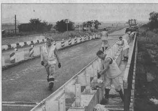
Мост через реку Порозиха.