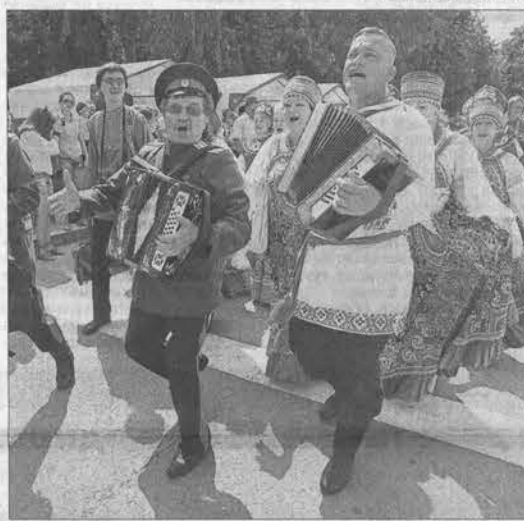
«Любо, братцы, любо!»

песни в жизни казачества: — Казачья культура — это и песня, и быт, и жизнь казаков, отношения в семье, уважение к старшим. В песнях вся наша жизнь. Казачьи песни многогранны, наша песня — это кураж и удача! Не одна «Воля» и не одна «Вольница» да «Вечора» из разных краев-городов выступали на сцене. А были еще и «Горлица», и «Сибирь», и «Жавороночки», и «Радунца» — всех и не упоминешь... Выступала и