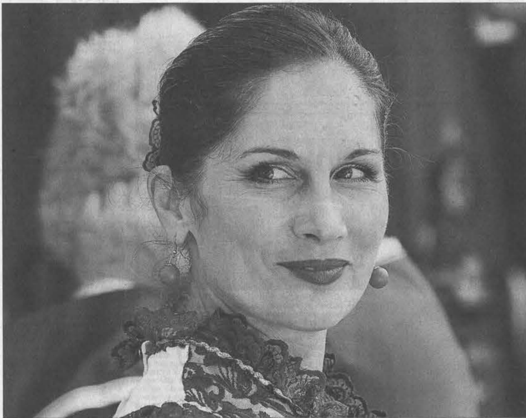
Ну чем не Аксинья!..

Открылся День города на центральной площади Белокурихи. Жителей и гостей в празднике поздравили заместитель губернатора, начальник Главного управления образования и молодежной политики края Юрий Денисов, глава администрации города Константин Базаров и другие официальные лица. Гости на сцене сменяли солисты и коллективы, зрители аплодировали юным танцорам и зрелым музыкантам. Все ждали праздничного шествия казаков. А когда наконец дождался, то одни зрители остановились на тротуаре и взялись за фото- и видеосъемку, другие пошли рядом с бравыми казаками и казачками-красавицами. Когда красочное шествие вступило на главную площадь праздника, к его участникам встретился епископ Алтайский и Барнаульский Сергей. Со сцены он обратился и к гостям праздника, и ко всем жителям края. Господь хочет видеть на земле правду, мир, дружелюбие, —