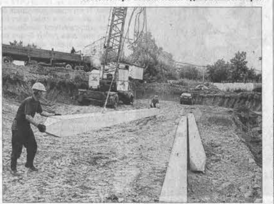
Идет разгрузка свай. Они будут основой фундамента.

По информации крайуправления по строительству и архитектуре, за прошедшие пять лет предприятия сферы инвестировали в основную капитал более 280 млрд руб., ввели в эксплуатацию около 16 тыс. зданий различного назначения площадью 5 млн кв. метров. В том числе 15 школ на 3,5 тыс. ученических мест, 23 объекта здравоохранения, 720 км газопроводов, 660 км электрических и 21 км тепловых сетей, помещений для крупного рогатого скота на 22 тыс. голов и сотни других сельскохозяйственных и производственных объектов.