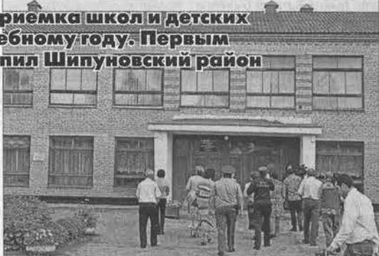
Школа принимает комиссию, а та - школы.

С названием села у образовательного учреждения есть общее - цифра 2. Чтобы не путать, их пронумеровали: Шипуново-2 и, соответственно, школа № 2 находится в 7 киломе-