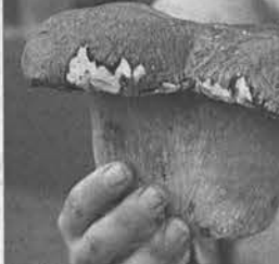
Вот такие грибы-гиганты уродились в этом году.