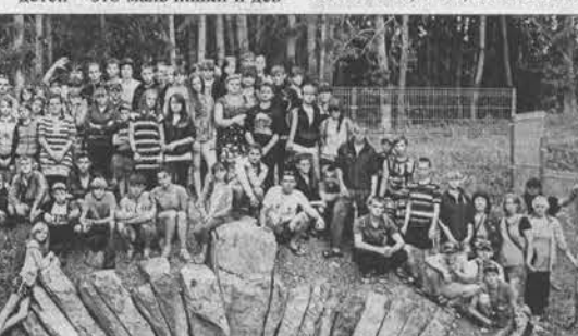
Павловские мальчишки и девчонки возле входа в Екатерининскую шахту в Змеиногорске.

ет 18 градусов, это соответствует санитарным нормам. Изменения и внешне, и внутренне в лучшую сторону есть. В рамках реализации комплексного проекта модернизации общего образования получаем мебель, компьютерное оборудование, интерактивные доски, мультимедийные проекторы, технические средства обучения, электронные образовательные ресурсы.