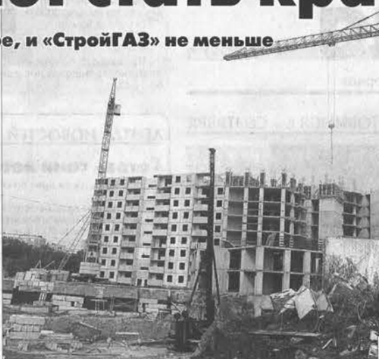
Совсем скоро объект станет вдвое выше и шире.

Насколько известно, в крае работают свыше 3000 строительных и проектных организаций, предприятий стройиндустрии и производителей материалов, а в них – около 30 тыс. человек. Мастер-класс Официальные поздравления с профессиональным праздником строители приняли в ДК Барнаула еще в четверг, 8 августа. Звучало много хороших слов. Пользуясь случаем, хочу к ним присоединиться. И так, в рамках краевых программ труженики отрасли обновляют материальную базу народного хозяйства, возводят и модернизируют жизненно важные объекты соцсферы, повышают уровень жизни земляков. Таковы региональные приоритеты, таковы запросы самого времени. Теперь о том, что сделано.