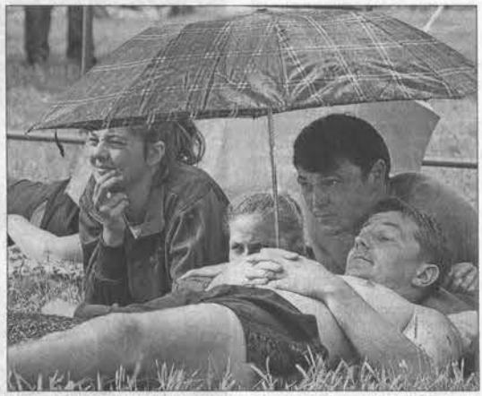
Не страшны теперь ни дождь, ни солнце!

Затем выступили звезды российской эстрады Вилли Токарев, группа «Бутырка», Александр Маршал.