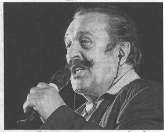
На сцене – патриарх русского шансона Вилли Токарев.

призер Олимпийских игр-72 Евгений Ловчев. Они приняли участие в церемонии награждения лучших команд турнира.