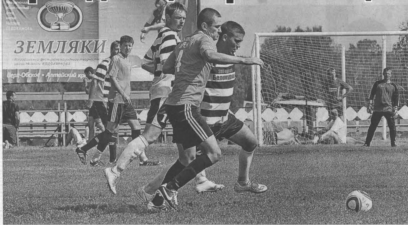
Белокурихинцы (в полосатой форме) уверенно выиграли футбольный турнир.

10 августа в барнаульском спорт-парке Алексея Смертина состоится «Фестиваль спорта», который будет посвящен Всероссийскому дню физкультурника.