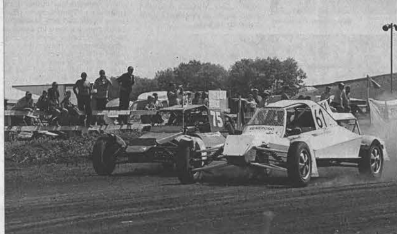
Под рыв моторов стартуют багги.

27 и 28 июля в Смоленском районе состоялась вторая этап Кубка края по автотрофи, в рамках которого впервые разыгрывался Кубок губернатора Алтайского края.