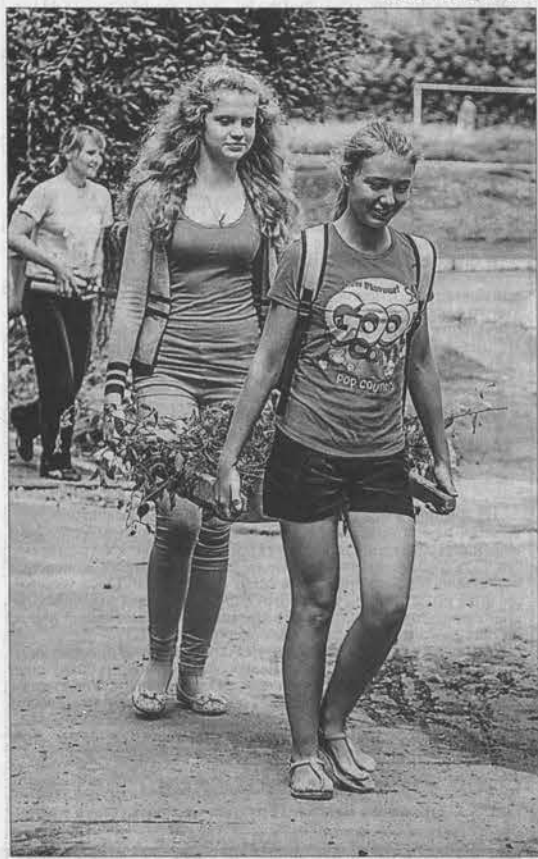
В лицее №112 много внимания уделяется благоустройству территории. И лето — самое подходящее для этого время.

Участниками ежегодной летней акции «Пятая трудовая» нынешним летом в Алтайском крае станут 12 тысяч подростков. Более 1800 несовершеннолетних запланировано трудоустроить в течение лета на предприятия и другие социально значимые объекты Барнаула.