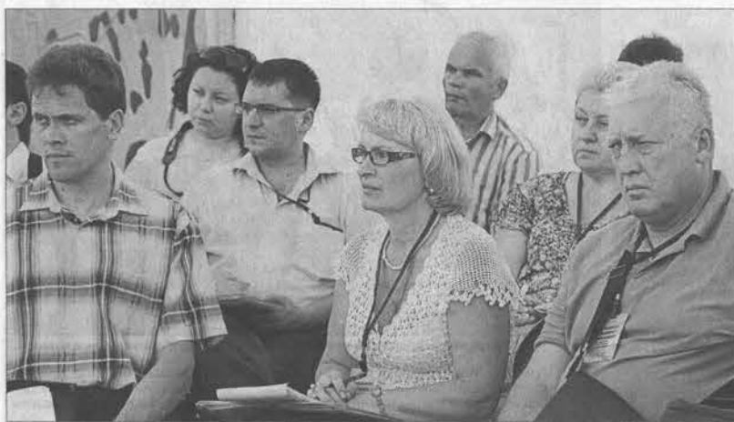
Программные изменения заставляют крепко подумать.

Директор департамента предложил сократить регламент выступлений докладчиков до десяти минут.