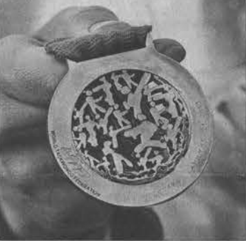
Эта медаль – самое высокое достижение алтайского тхэквондо.