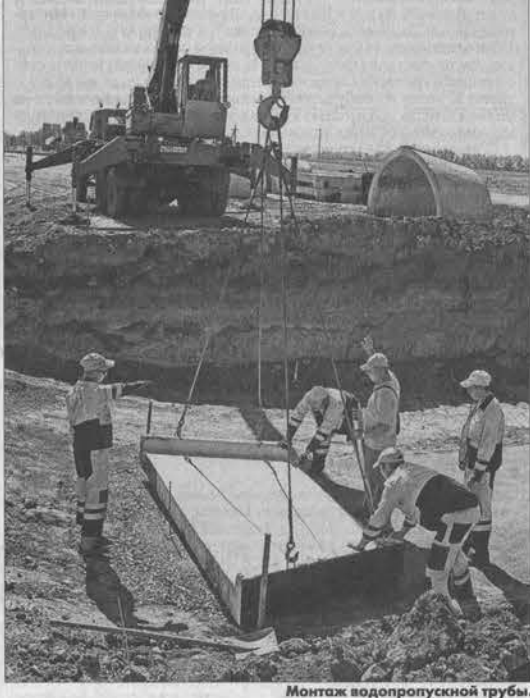
Монтаж водопропускной трубы.