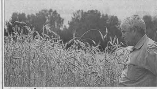
Состояние зрелых вызревает оптимизм у козихинцев.

На Алтае научились получать урожаи не ниже кубанских