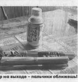
Товар на выходе – пальчики облизнешь!