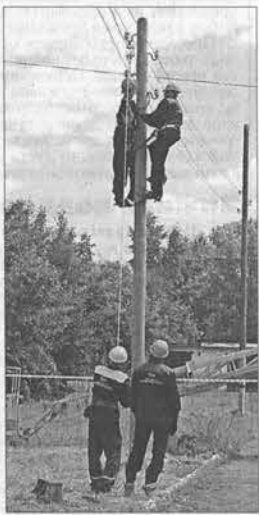
Ох и натерпелся поришишко-манекен!

Если в текущем году по региону планируется отремонтировать более 7,5 тыс. км электрических сетей напряжением 0,4-10 киловольт, то, например, «Алтайкрайэнерго» включило в программу обновления свыше 2,5 тыс. сетевых километров. Притом в руководстве компании решили совместить полезное с приятным – по ходу ремонтных работ они провели соревнования профессионального мастера на звание «Лучший электромонтер коммунальной энергетике». На ристалище вышли девять команд (по три человека) из всех межрайонных отделений компании.