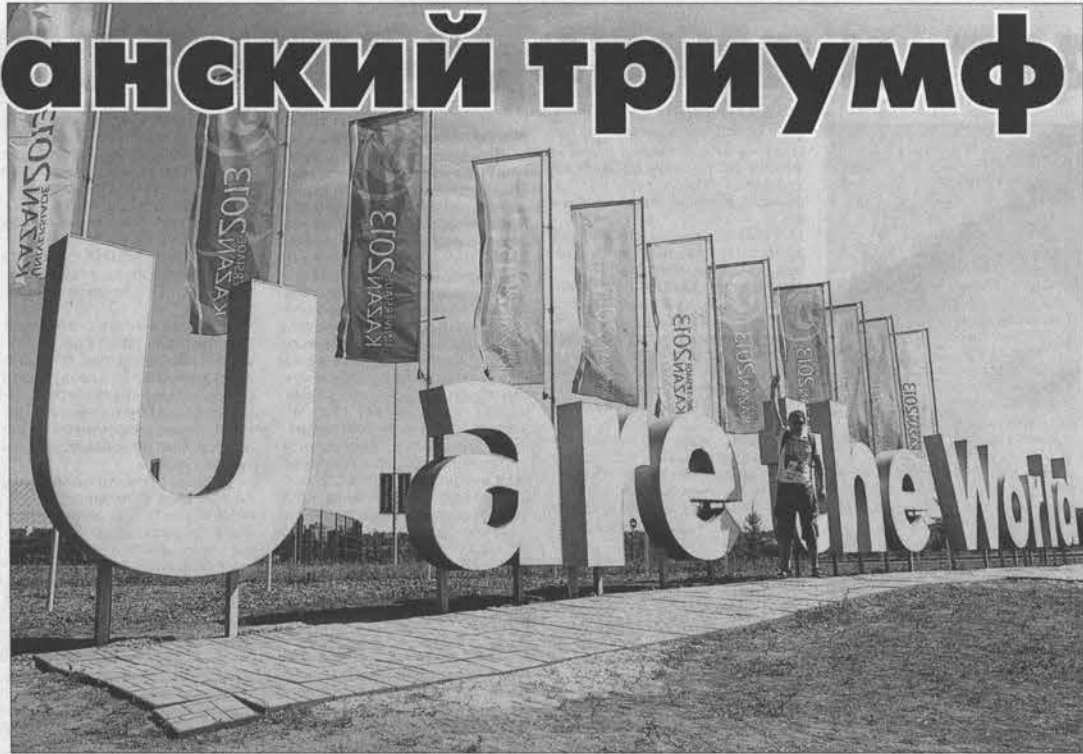
Слоган Универсиады в Казани можно перевести как: «Весь мир в тебе».

На церемонии закрытия, которая получилась очень пышной, президент FISU (Международная федерация студенческого спорта) Клод-Луи Гальен отметил, что эта Универсиада –