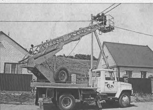
Соревнования - жильцам на радость.

Итак. Среди прочего практика включала монтаж линей-