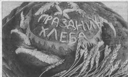
Не просто каравай - произведение искусства!

Оказывается, испечь обычную буханку хлеба совсем не просто. Большую роль в процессе выпечки играет не только качество муки и воды. Немаловажным является и настроение самого мастера.