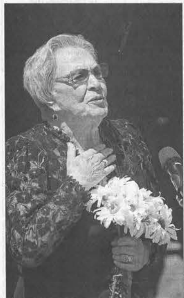
Народная артистка России Римма Маркова сожалеет, что при жизни Шукшина о нем не говорили как о гении.