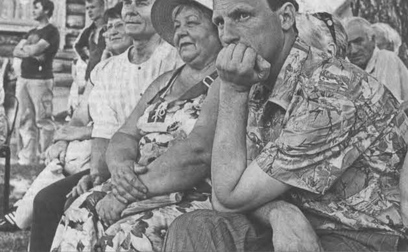
На фестивале самодельных театров и чтецов «Характеры» зрители услышали не только шукшинские строки, но и отзывы из Остроговского и произведений современных авторов.