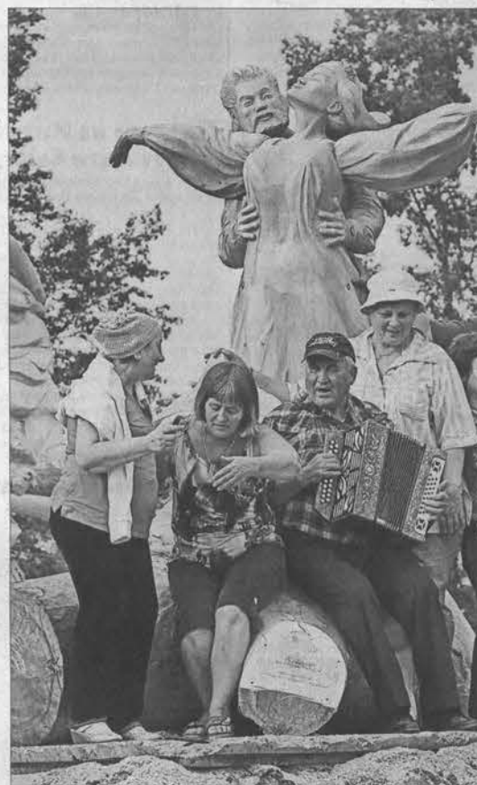
В селе Полеводка на площадке фестиваля парковой скульптуры суботним вечером было народное гуляние «Вечерок».

«И объясни маме, на кого я учусь» Одним из центральных суботних событий стало открытие художественно-документальной выставки в Сростинском музее-заповеднике писателя. Она называется «Шукшин во ВГИКЕ»