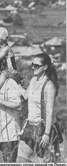
Имя писателя по-прежнему притягивает сотни людей на Пикет.