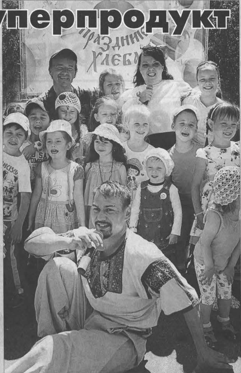
Кто сплет про хлеб лучше всех, тот получит большую конфету.