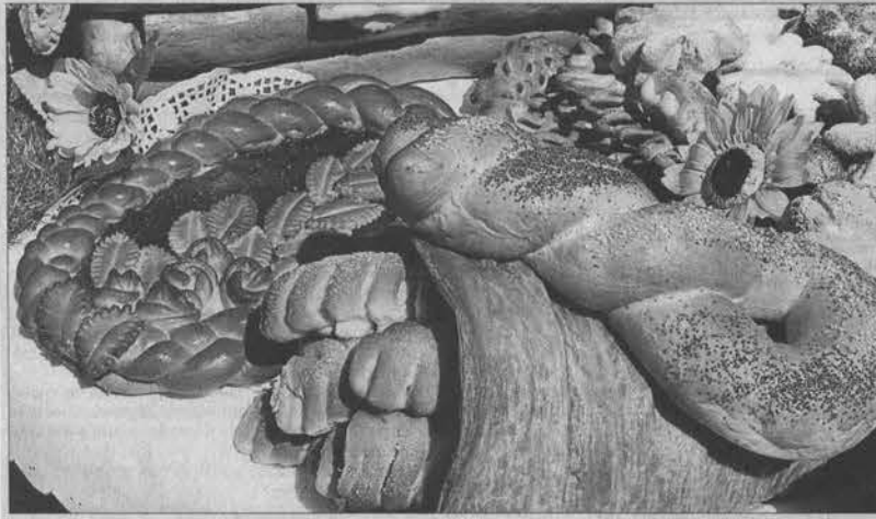
С пылу, с жару!

Прямо из печи калачи и караван попадали на «Праздник Хлеба»