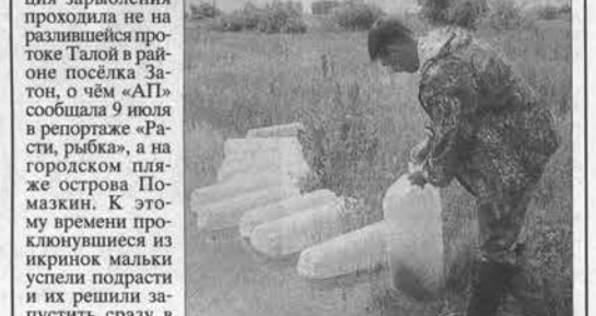
В этих баллонах мальков привезли из питомника, чтобы выпустить в реку.

Еще 400 тысяч мальков сазана выпущено на днях в реку Обь.