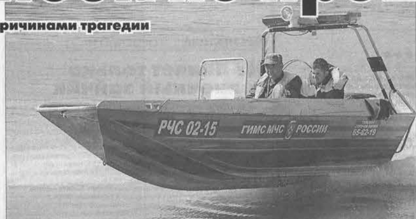
У инспекторов ГИМС сейчас самая горячая пора.