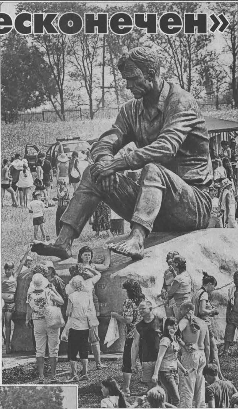
В воскресенье на Пикете.