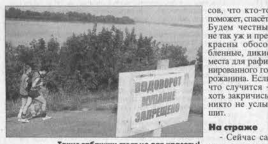
Такие таблички стоят не для красоты!

Погода в этом году, честно сказать, не особенно располагает к отдыху на реке или озере. По-настоящему жаркие денечки так редки... Потому-то, как только выглянет тёплое солнышко, и стремятся люди к воде: как же пропустить такой долгожданный летний подарок? А если распогодится в конце рабочей недели - тогда даже автомобильные пробки на многие километры растягиваются на федеральных трассах. Все рвутся на природу из душного города... Началось... - Обычно купальный сезон открывается официально 1 июня: считается, что к этому времени вода набирает комфортную для человека температуру, - объяснил Сергей Ковалёв, заместитель начальника отдела ГИМС Главного управления МЧС России по Алтайскому краю. - Но в этом году в реках стало приятно плескаться буквально на днях. Причина - вода после паводка только только начала спадать и просто не успела прогреться до нормальной температуры. Но, к сожалению, несчастные случаи мы начали фиксировать уже с мая.