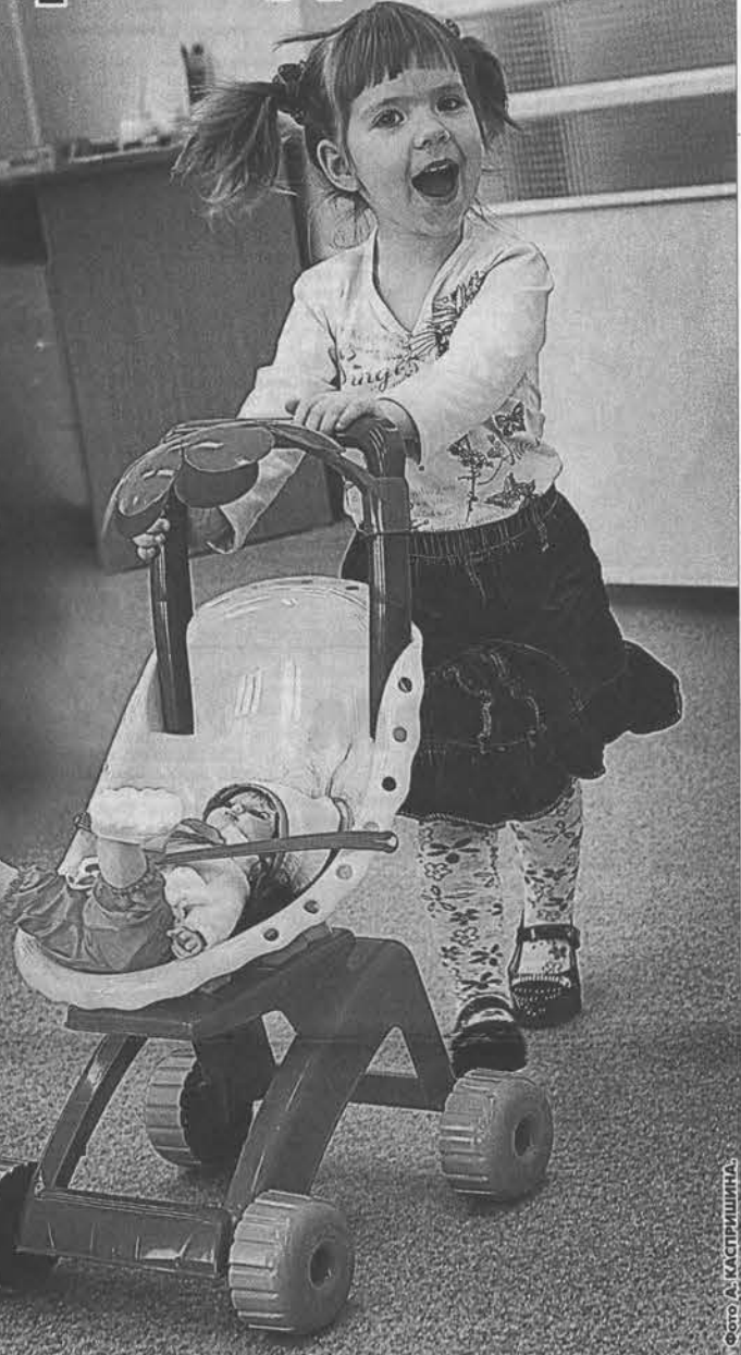
свою нишу в производстве детских товаров.

Предприятия Алтайского края готовы предложить для реализации новой Стратегии свою продукцию. Регион располагает сырьевой базой - мясом, молоком, овощами, зерновыми культурами, - отвечающей требованиям качества и экологичности. Кроме того, некоторые местные предприятия уже давно завоевали