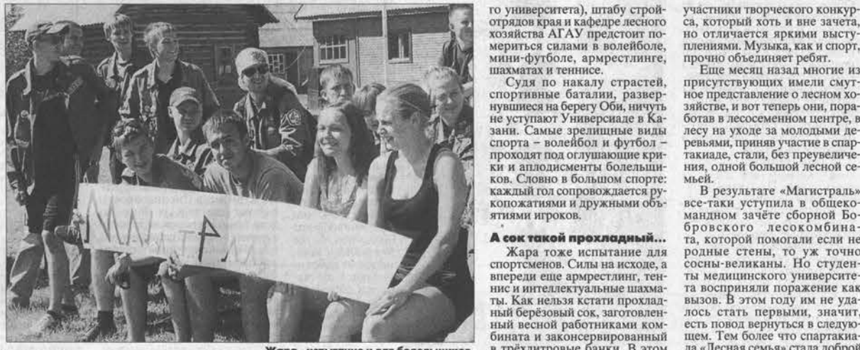
Жара - испытание и для болельщиков.

«Быть спортсменом - значит быть в тренде» - так считают участники строительного отряда «Магистраль», первыми прибывшие под громкую музыку на рыболовно-охотничью базу в селе Рассказиха. Ребята ведут хроникальный дневник из жизни стройотрядовцев на камеру. Они уверены в победе, и если это удастся, то обещают следующим летом вновь приехать на работу на Бобровский лесо-