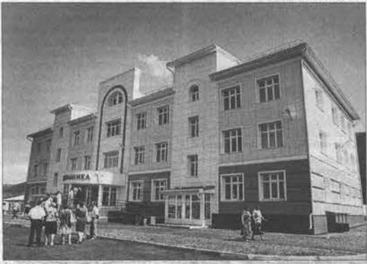
Красиво снаружи, комфортно внутри.

ну. Строительство поликлиники в Чарышском районе было одной из приоритетных задач. Это самый новый медицинский объект в крае, обеспеченный современным оборудованием. Но это был и самый тяжелый про-