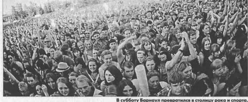
В субботу Барнаул превратился в столицу рока и спорта.