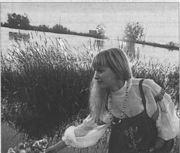
Венок – очень важный атрибут традиций.

Окрестности села Новотырышкино благодаря компании «Курорт «Белокуриха» стали местом грандиозной исторической реконструкции незадолго до праздника Ивана Купалы. По количеству гостей, съехавших со всей Сибири, и демонстрации чудес алтайского фольклора его уже можно сравнить со знаменитым латышским Лиго или Венецианским карнавалом. А уж какой-нибудь итальянский день забрасывания всех помидорами, или бег по улицам от испанских быков, или, почти господи, флешмоб и рядом не стояли!