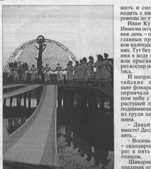
На берегу Лебединого озера.

действие началось, как вечерние сумерки, незаметно. Еще плюс – не было уже привычных слов какой-нибудь представительницы сельской власти о значении народных праздников или фейерверков в нашей жизни. – В эту ночь соединяются вода и огонь! Сразу бросалась в глаза разница между городскими фольклорными коллективами и доморощенными. Первые больше смотрятся на асфальте и до десяти часов вечера, факт. Остальные, та же «Ярманка», в Новотырышкино брали душевностью и народными костюмами из бабушкиных сундуков. Таких сами Сварог, Дажьбог велили слу-