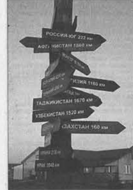
Алтай – центр Евразии.

ДПС, сотни километров пути, несколько тысяч владельцев разных машин со всех сибирских городов и весей возбужденно выгружались вместе с домочадцами и друзьями в поле возле туркомплекса «Конный двор», что под Белокурихой. – Смотри, как поди! – услышал я разговор рядом. Это мужики разглядывали крутой джип с новосибирскими номерами. – А начался с паленой водки и пяти коммерческих киосков. Где мы в то время были, Петрович? – А мы ту водку пили! С этими шутками-прибаутками народ стал растекаться по различным аттракционам, конюшням, загонам с маралами и к кетгам с пивом. Я же направился напрямик к озеру с белыми лебедями. Весь берег с камнями был утыкан факелами, к огромной раковине-сцене над спокойной водой было протянуто несколько сходен. Женщина из