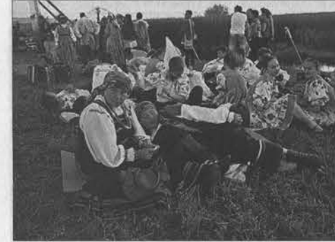
В ожидании хоровода.

Нижнеартовска в венке, обвешанная снопами и свежескошенной травой, говорила по смартфону с подругами: – Я тут богиня плодородия... Справа-слева, сзади – по всему берегу на былин-траве живописно восседали сотни не менее живописных крестьянок и профессиональных танцовщиц. Вокруг колеса на столбе летали на канатах дети. С таким визгом, что было страшно: слышно ли будет происходившее на сцене? Мне понравилось, что само