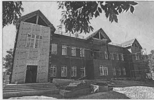
Так сегодня выглядит будущий музей М.Т. Калашникова.

не были сорваны купола, разрушена колокольня. С тех пор здание использовалось под амбар для хранения зерна, потом как Дом культуры. Теперь на добровольные пожертвования граждан ведется реконструкция здания Знаменской церкви. Собрано более 4,5 млн. рублей, в том числе значительные сред-