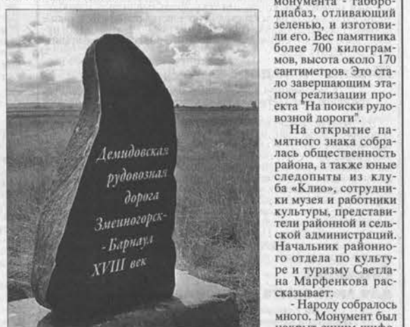
Демидовская рудозавозная дорога Змеиногорск-Барнаул XVIII век

Развитие горнорудного производства на Алтае связано с именем Акинфия Демидова. В 1725 году его рудозавозцы под горой Сихой впервые нашли подметаллическую руду. После этого был построен Кольвано-Воскресенский завод. Выплавленную на нем медь обозами перевозили на Урал, а затем серебряную руду из Змеиногорска, а также другие полиметаллы. Таким образом, в 18 веке проложили дорогу, которая пролегла и по территории нынешнего Поспелихинского района. Благодаря ей вдоль тракта появились новые поселения, среди которых самое старинное и большое село – Калмыцкие Мысы.