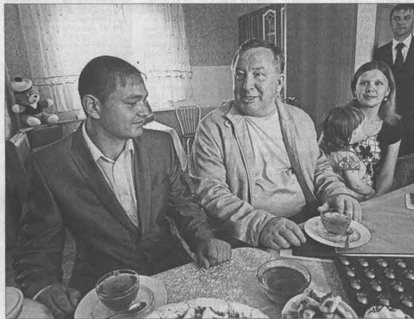
Губернатор края Александр Карлин в гостях у семьи фельдшера Евгения Пшальникова.

министра Курьинского района Вячеслав Кошов. - Это было сделано в ближайшее время. Но вместе с тем предстоит благоустройство и всего Кольванского сельского совета, который становится центром тури-