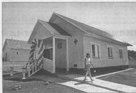
Новый ФАП в поселке им. 8 Марта.