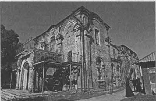
Восстановление церкви – дело общее.

Кроме этого здесь реализуется еще один масштабный проект – строительство мемориального музея Михаила Калашникова на базе бывшей средней школы. Думаю, к предстоящей зиме музей начнет свою работу как действующий. Кроме этого идет восстановление православного храма, где Михаил Тимофеевич был крещен.