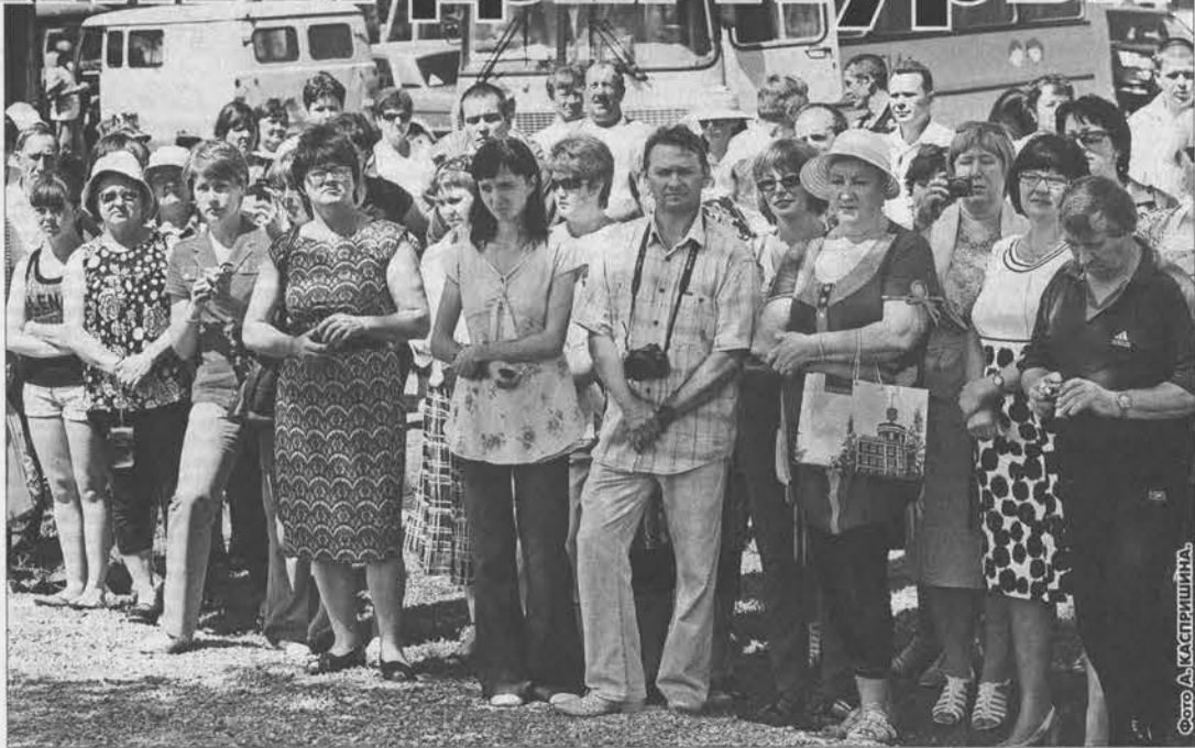
Все село пришло на открытие.