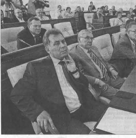
Рабочий момент совещания.

центра Алтайского края: «Очень важно, когда глава исполнительной власти – губернатор – понимает важность представительного органа власти. То, в каком здании работает парламент в регионе, демонстрирует уровень взаимопонимания двух ветвей власти. Если говорить об Алтайском краевом Законодательном Собрании, то это положительный пример слаженной работы. Я очень рада побывать в краевом Парламентском центре. Для депутатов региона важно, чтобы новое красивое здание было полностью хорошо содержалось. Пожалуй, это даже гораздо сложнее, чем отремонтировать старое здание. Алтайское краевое Законодательное Собрание считается одним из лучших в Российской Федерации – и по подходу к работе, и по законодательным инициативам, которые мы направляли в том числе и в Москву, и благодаря работе председателя краевого парламента. Но сегодня нужно ставить новые задачи и нужно им соответствовать. Нужно быть по-