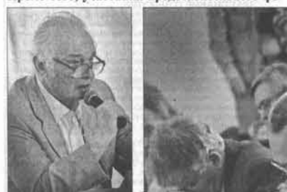
Валерий Ганичев: Писатель должен обращаться к сердцу читателя...