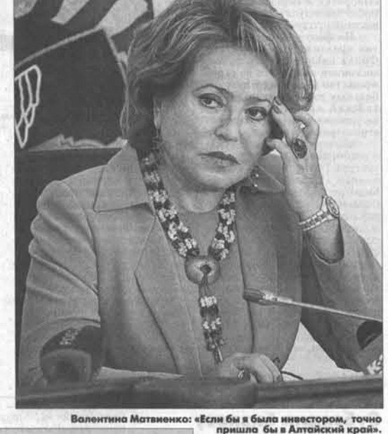
Валентина Матвиенко: «Если бы я была инвестором, точно пришла бы в Алтайский край».