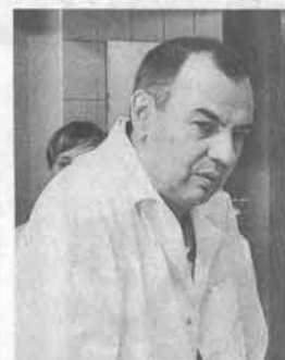
Это старейшее учреждение в стране, имеющее свою историю, наработки, традиции. Могу сказать, что в вашем Федеральном центре положено очень хорошее начало, все, что сейчас делается, правильно, у вас отличные специалисты. Как центр будет развиваться в дальнейшем, покажет время. Мне очень приятно отметить, что лечение проводится на уровне лучших клиник Европы.