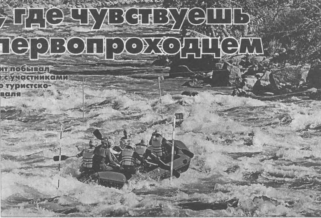
Рафтинг на реке Ховд – редкое зрелище.

На берегу горной реки Ховд, недалеко от посёлка Эрэнзубурэн, с 9 по 15 июня был разбит юрточно-палаточный лагерь. Вокруг раскинулись горы Монгольского Алтая, которые вы-