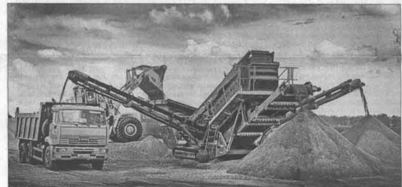
«Грохот» для щебня.