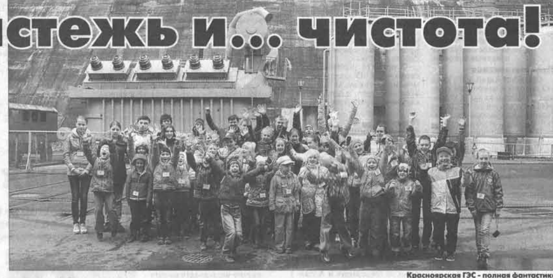
Красноярская ГЭС — полная фантастика!