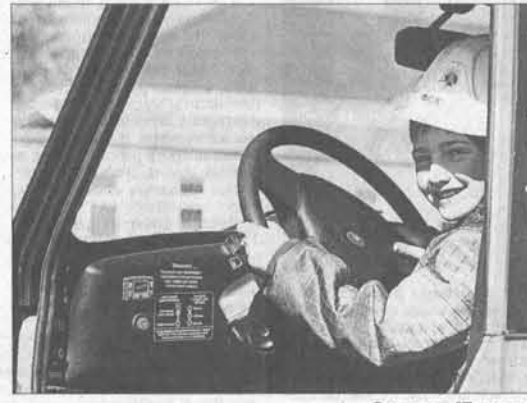
Он сказал: «Поехали!»

Со школьной скамьи нам твердят: электричество очень опасно! К сожалению, некоторые из граждан убеждаются в этом лишь на своем горьком опыте... Охраняемая зона объектов электроэнергетики соблюдается потребителями невнимательно. А ведь на деле правила обращения с обо-