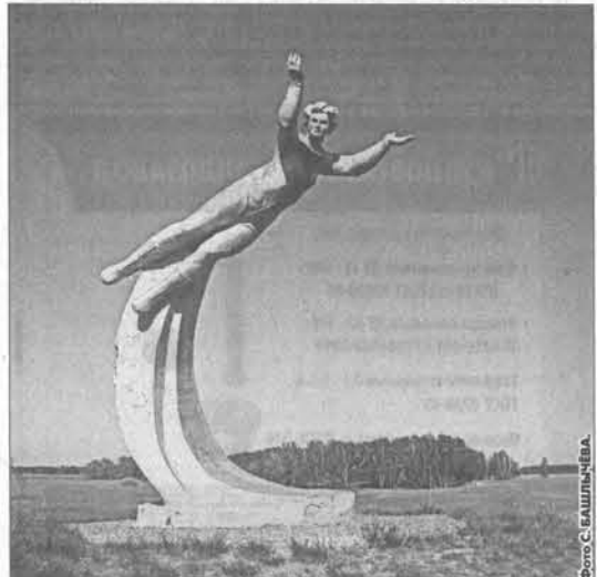
Бавеский район, памятник Валентине Терешковой.