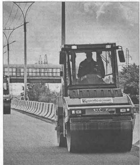
... А дорога ровной лентой выется.

Применению новаций в дорожной отрасли был посвящен семинар, в котором приняли участие представители Омской области и Республики Алтай. Ну а главными участниками его стали руководители ДРСУ Алтайского края. Они ознакомились с тем, как идут сегодня работы по ремонту и реконструкции на федеральных трассах. Организаторами семинара выступили краевое управление по транспорту, дорожному хозяйству и связи и КГКУ «Алтайавтодор».