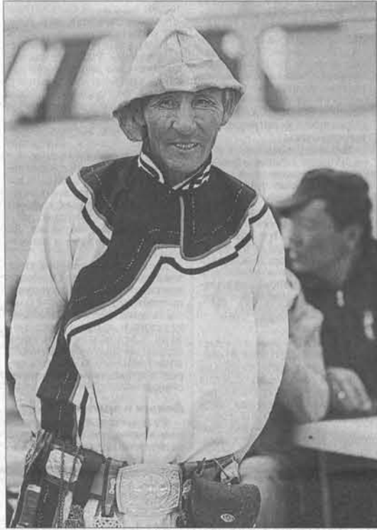
Фестиваль пришелся монголом по нраву.

глядят посуровее, чем, к примеру, в большинстве районов российского Горного Алтая. В первое утро подъем оказался ранним – от жары, накалившей палатку, словно печку. По пути на реку два-три раза укололось о верблюжью колючку. Их тут, оказывается, тьма-тмущая. Спортсменами они то и дело забывались в кроссовки. А соревнования по велотуризму и вовсе пришлось отменить – участникам надоело с проколами от колючек возиться!