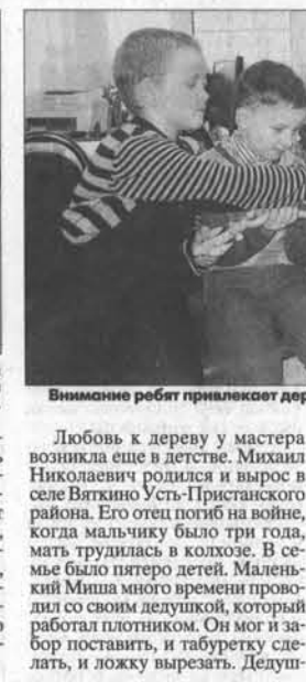
Внимательно работ приклеивает деревянную цепь, которую ремесленник вырезал из цельной древесины.