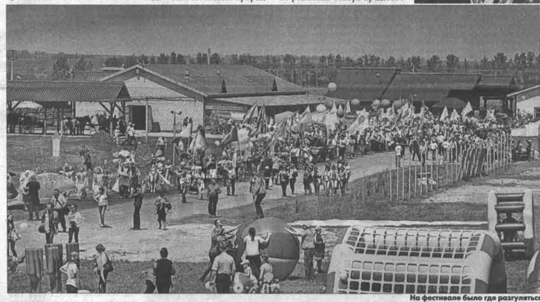
На фестивале было где разгуляться!

Запуск новой технологической линии по розливу минеральной воды занял около года. Значительная часть этого времени потребовалась на оформление всей необходимой документации, получение лицензий. Параллельно шла установка современного технологического оборудования. Сегодня только Бочкаревский пивоваренный завод имеет право продавать населению, поставлять в аптеки и лечебные учреждения «Завьяловскую» сульфатно-магниево-минеральную воду. Тем более что интерес к этой воде проявляют санаторно-курортные предприятия Белокурихи и Барнаула. (Окончание на 2 стр.)