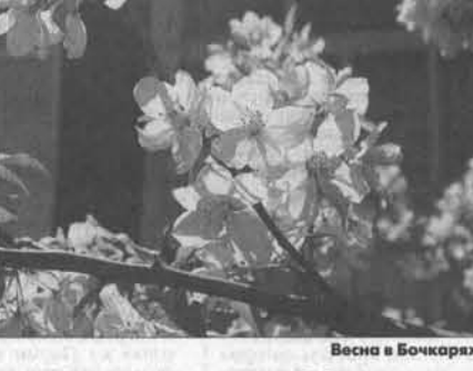
Весна в Бочкарях.

1000 гектаров, - рассказывает он. Во время посевной механизатор зарабатывает до трех ты-