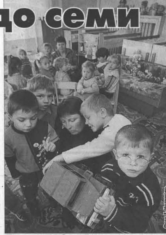
Доступный детсад - мечта многих родителей.

В рамках действующих программ в 2013 году запланировано открытие дополнительных мест в 56 территориях края, имеющих в этом потребность. Проектом постановления Правительства Российской Федерации на модернизацию системы образования Алтайскому краю предусмотрено более 1 млрд. рублей. Эти деньги будут потрачены на строительство и реконструкцию зданий дошкольных учреждений. Около 500 млн. выделено из