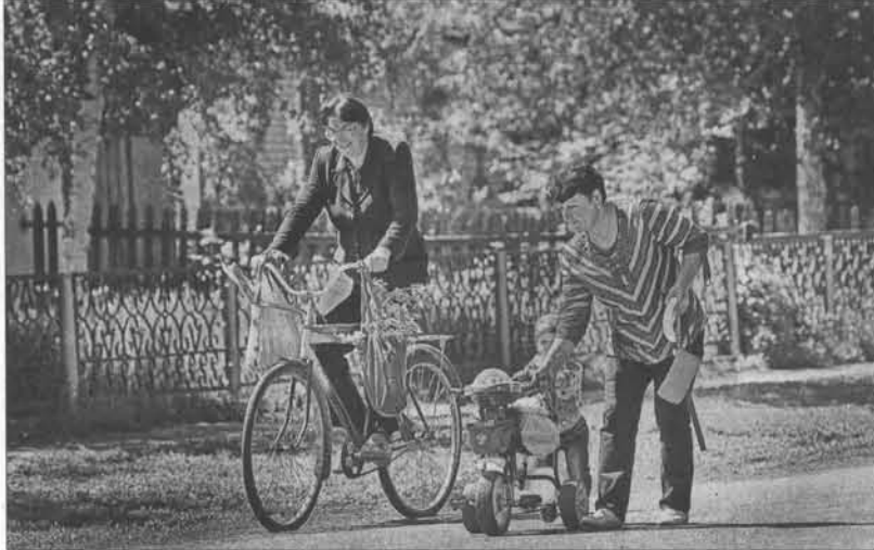
Центральная улица Урлапово носит имя 30-летия Победы.

В ходе рабочей поездки в Шинуровский район губернатор провел совещание по вопросам балансирования местных бюджетов и эффективности расходования бюджетных средств. В совещании участвовали руководители ряда краевых управлений, представители ассоциаций