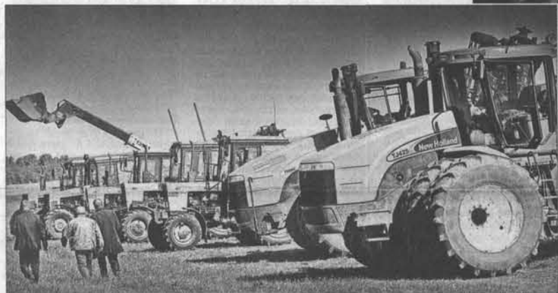
Технический арсенал колхоза имени Кирова всегда вызывал зависть у соседей.