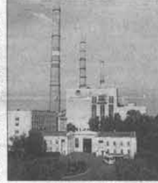
Петропавловскую ТЭЦ запустили барнаульские энергетики.

3 июня барнаульский завод «Сибэнергомаш», входящий в энергомашиностроительный холдинг «НОВАЭМ», завершил режимно-наладочные испытания котла на Петропавловской ТЭЦ-2 в Казахстане.