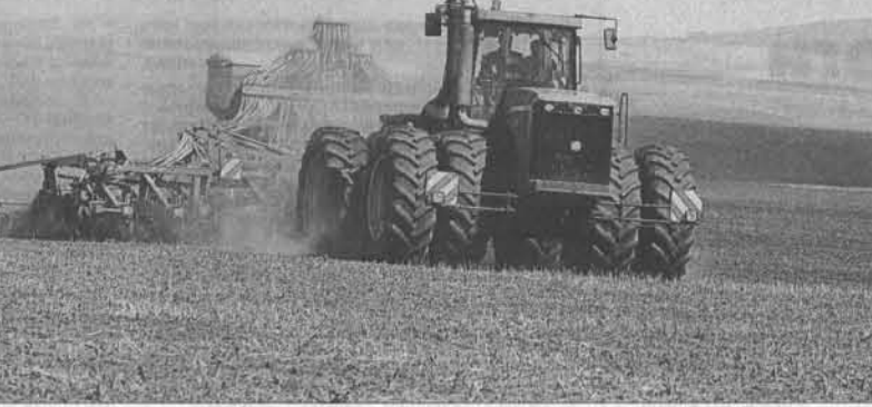
Современная техника пришла на поля Целинного района. Без минеральных удобрений хороших урожаев не получить.

- Первую посевную работу на этой машине. В восторг от неё. С начала полевых работ с помощью семян уложили в почву семена на площади около