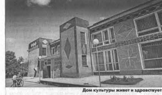
Дом культуры живет и здоровствует.

часто имеем в виду какие-то абстрактные понятия. Но сегодня в Урлапово мы как раз можем не только увидеть, но и руками потрогать тот самый социально ответственный бизнес. Здесь в прошлом году построили два дома для работников предприятия, в этом году еще две семьи переедут в новые дома, построенные колхозом. Здесь предприятие помогает детскому саду и обустроивает село, заботится о людях, создает комфортные условия для жизни. Такой бизнес и называется социально ответственным, - считает губернатор.