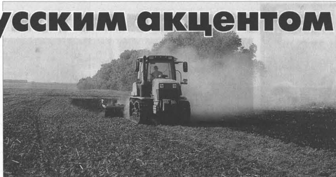
Трактор «Беларусь-2103» – в поле.