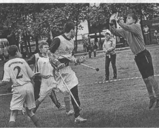
Вратарь рубцовского «Спартака» отразил угрозу.