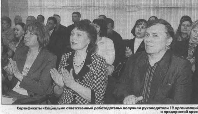
Сертификаты «Социально ответственный работодатель» получили руководители 19 организаций и предприятий края.