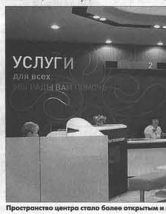
Пространство центра стало более открытым и интерактивным.

прежними офисами продаж мы полностью поменяли концепцию работы – от внешнего оформления, освещения, навигации – до внедрения системы прямой выкладки товаров. Мы учитывали пожелания и потребности клиентов. Тем самым стремимся добиться главного – улучшить обслуживание посетителей центра. Надеемся, нам это удалось».