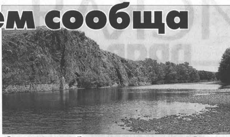
Прекрасна природа нашего края. Южная часть нового краевого комплексного заказника «Чарышская степь».

Уже 25 лет занимаюсь экологическими проблемами. За это время много воды утекло, прошло с десяток реорганизаций в экологических подразделениях. По моему мнению, не все новости на пользу. С 1988 года, когда образовалась природоохранная структура в стране, и до 2001