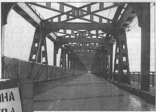
Коммунальный мост опустел.

Когда 17 мая стало известно о провале перекрытия на одном из участков коммунального моста через Обь в Барнауле в приостановке движения по нему, многие жители краевой столицы, Новоалтайска и других населенных пунктов по обе стороны главной реки Западной Сибири надеялись, что дырку быстро залатают и она снова сможет курсировать туда и обратно коротким путем.