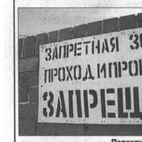
Перекрыли старый мост.

Если у барнаульцев за мостом расположено несколько садоводческих товариществ, то немало новоалтайцев каждый день ездит в Барнаул на работу. Интенсивное движение общественного транспорта между двумя городами позволяет быстро и за умеренную цену преодолевать это расстояние. Особенно удобно добираться в центр на «Газели», время в пути всего 30 минут. В самом Барнауле из-за автомобильных пробок на Павловском тракте и других магистралей на это уходит целый час. Однако прошло уже почти две недели, а движение по коммунальному мосту до сих пор закрыто, причём на неопределённый срок, путь транспорту прерывают бетонные блоки. Теперь водители микроавтобусов предлагают новоалтайцам ездить в краевую столицу обходным путем – через новый мост, но по двойному тарифу – 56 рублей.