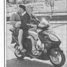
А вот так ездить нельзя. Садясь за руль двухколесного друга с ревушим мотором, не забудьте пятиколесный. Последствия неправильной езды могут быть самыми печальными.

Екатерина ЗЕЛЕНОВА, Сергей БАШЛЫЧЕВ (фото).