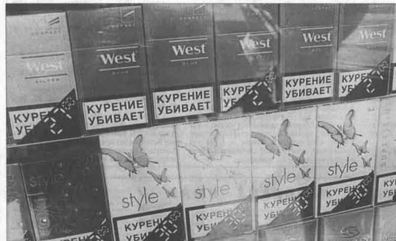
За красивыми упаковками - смертельная опасность.