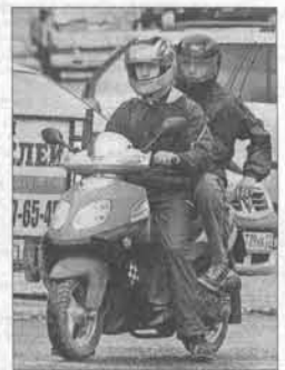
Вот так правильно.

Профилактическое мероприятие «Скутер» помогает выявить правонарушения, которые совершают водители мототехники.