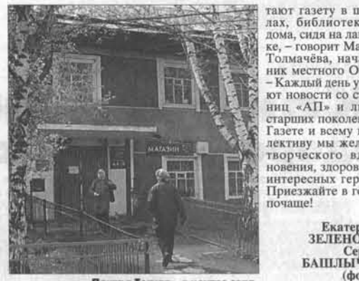
Почта в Тогуле – в центре села.