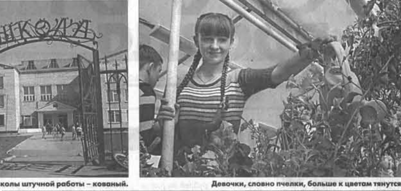
Девочки, словно пчелки, больше к цветам тянутся.

следующем: вырастить урожай от начала до конца, суметь подсчитать затраты, научиться реализовывать продукт, наконец, грамотно пользоваться вырученными деньгами. Экономика в действии!