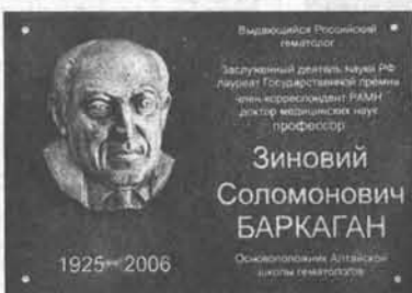
Мемориальная доска открыта в кровной поликлинике, где находится и лаборатория гемостаза, основанная выдающимся учёным.