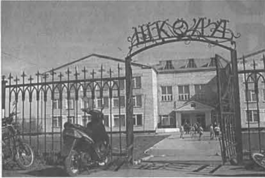
Заборчик у школы штучной работы — кованный.