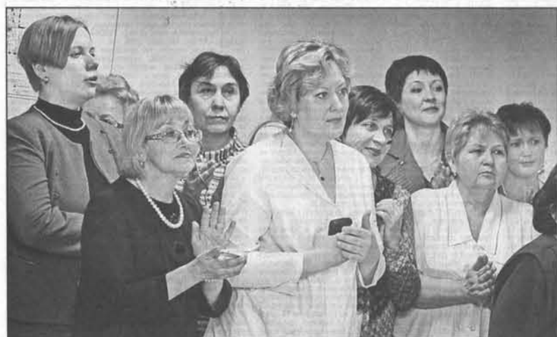
Для всех присутствующих открытие мемориальной доски стало запоминающимся событием.