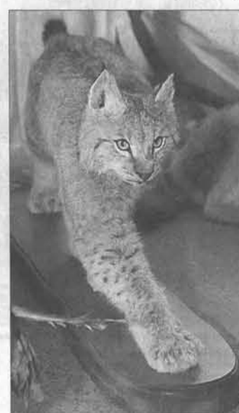
Современные материалы позволяют делать чучело очень реалистичным. Такая рысь может и испугать.

В Барнауле в музее «Город» открылась уникальная выставка «Животный мир Алтая».