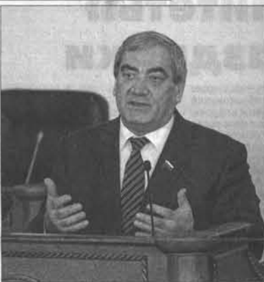
Депутатов АКЗС поздравляет заместитель председателя Совета Федерации Вячеслав Штыров.