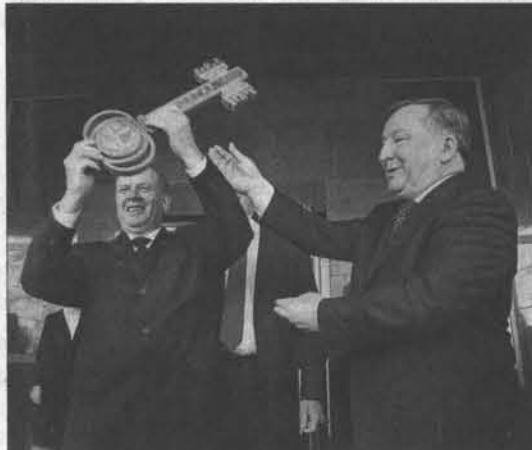
Губернатор Александр Карлин и председатель АКЗС Иван Лоор с символическим ключом от нового здания.

корпуса, самоотверженности неравнодушных к судьбе региона людей. Понятно, что разные времена требовали разных подходов. Но можно уверенно говорить о том, что депутаты всех созывов добросовестно выполняли свой долг.