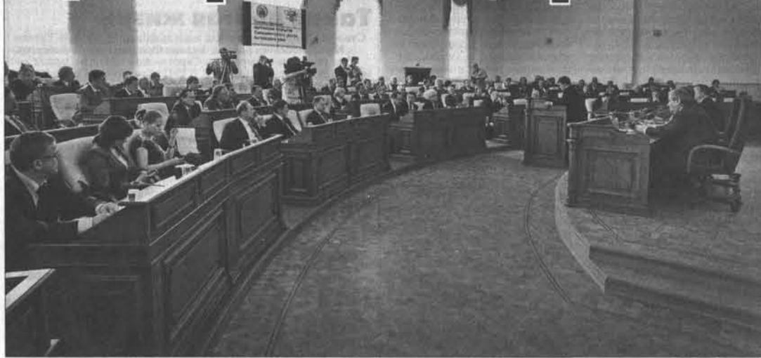
В новом зале заседаний.