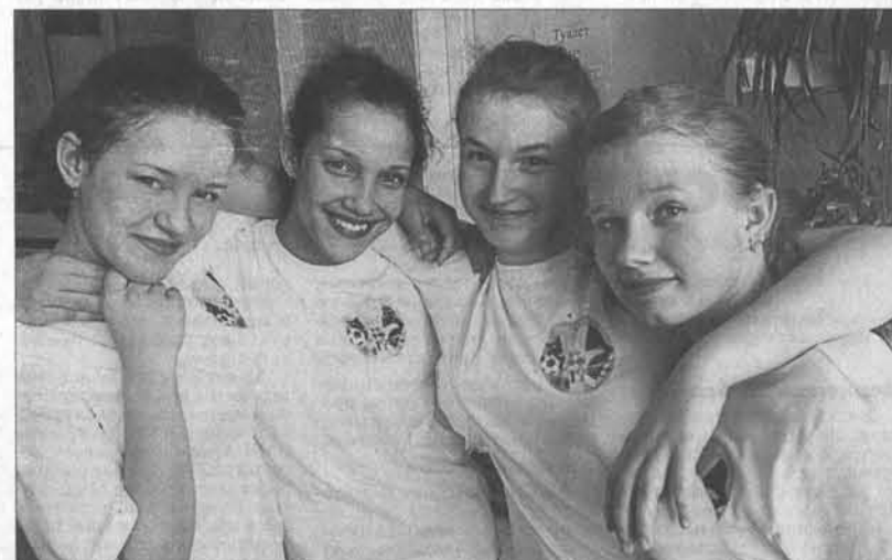
Ученицы краевой коррекционной общеобразовательной школы 1-2 типа стали лауреатами с песней «Мы вместе».

«Вот такая круглая песенка!» – поют руками младшие школьники.