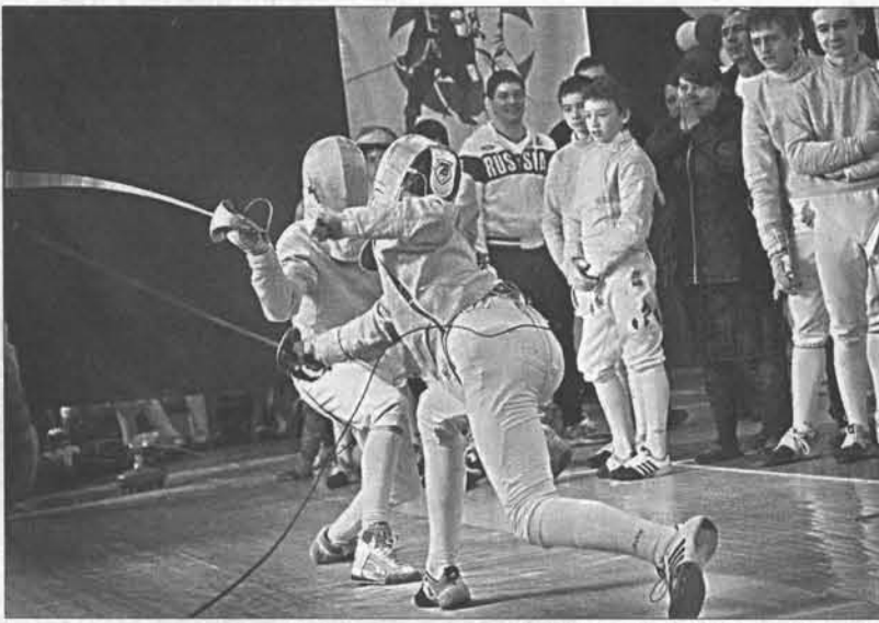
В сабельном фехтовании все решают доли секунды.

В своем письме игроки «Динамо» даже пригрозили не вы-