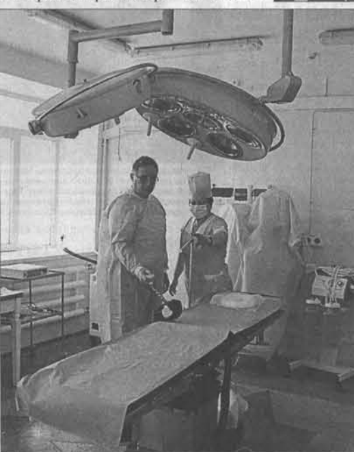
Хирургическое отделение серьезно обновилось. Но ремонт и перепланировка помещений не ограничилась. Сюда еще поступило новое оборудование.

Сегодня обновленное хирургическое отделение работает в нормальном режиме. Красивые и удобные палаты с новой мебелью и мягким интерьером. Над кроватями - индивидуальные светильники, есть общий ночной, в каждой палате - квадратная лампа.