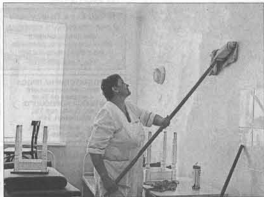
Чистим-протираем, красоту наводим!

У нас нет, заявки на него шлем регулярно уже больше десяти лет. Еще одна серьезная проблема – отсутствие в операционных и процедурном кабинете активной вентиляции. Бытовые кондиционеры не спасают, приходится проветривать, открывая настежь окна. При разговоре со строителями просили учесть вентиляцию, но, видно, денег не хватило. Доктора озвучили еще ряд вопросов, которые требуют внимания: нехватка инструментов и лекарств, недостаточное финансирование, низкие зарплаты и, как следствие, серьезный кадровый голод, который испытывает сегодня камская медицина, огромная нагрузка на работающих на износ врачей, большая часть которых пенсионеры.