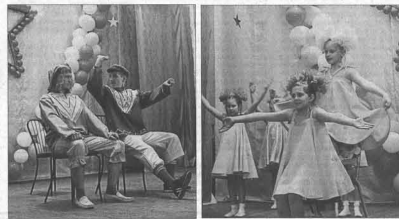
Пантомима «Эх, прокачу» (Новоалтайск).

алтайска никакого сопровождения не было. Но действия незадачливого водителя, который то не мог завести автомобиль, то просил пассажира толкнуть его, постоянно выбегая из кабины и обозначая действия потешными жестами и мимикой, вызвали сначала смехи в полной тишине, а потом громкие одобрительные овации. В итоге лауреатами фести-