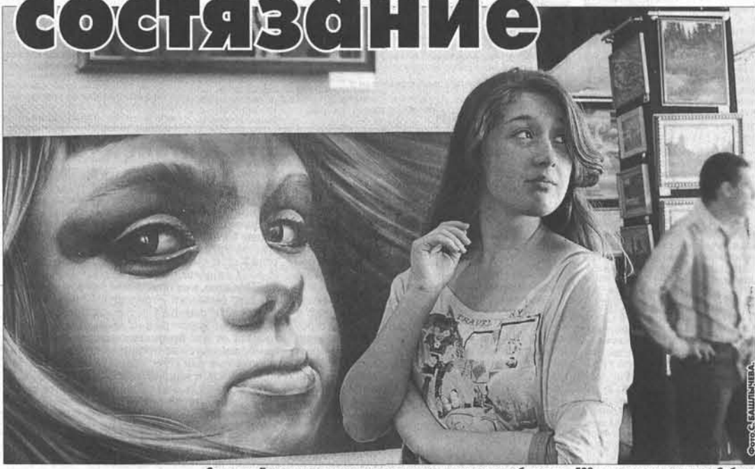
Сегодня в Барнауле можно увидеть лучшие произведения более чем 500 молодых художников Сибири.

Наконец, 9 апреля в выставочном зале Института архитектуры и дизайна АЛТИУ пройдет презентация цифровой графики «Digital art». И это не считая уже работающих с середины марта экспозиций «Настоящее» в «Открытом небе» и «Когда мы были молодыми...» в частной галерее «Кармин». И все же основное внимание, что естественно, приковано к выставочному залу Союза художников, где размещена конкурсная экспозиция по номинациям «Живопись», «Скульптура» и «Декоративно-прикладное искусство», и огромный площадям галереи «Республика ИЗО», полностью отданным под графику. Если уж говорить о прогрессе и некоем росте нашего долгоиграющего выставочного проекта — эта тема не раз всплывала в первые дни его работы, когда в