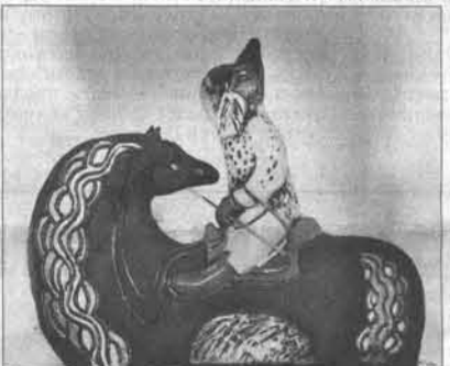
«На заставе» — новое произведение кемеровского керамиста Оксаны Кондрашовой, лауреата прошлого конкурса.