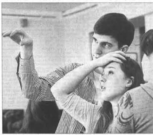
Творческий озарение озаряет...

наул – культурная столица юга Сибири. – Думаю, и в дальнейшем при таком замечательном представительстве и обилии прекрасных