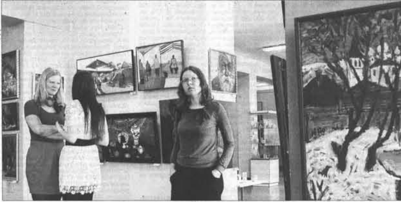
Стены выставочного зала Союза художников сейчас завешены в несколько рядов.

Сила и слабость Что касается экспозиции, размещенной в выставочном зале Союза художников, то первое, что бросается в глаза, – это обилие скульптуры и предметов декоративно-прикладного искусства. Для Сибири в целом такое положение дел, как признают специалисты, довольно необычно. На стенах кроме, собственно, холстов также расположены объемные берестяные фигуры, деревянные и керамические маски, мозаичные и эмалевые панно, гобелены. На специальных подиумах в центре каждого из залов – то остроумные архитектурные инсталляции, то изощренная керамика и металл, пластика, то скульптуры из металла.