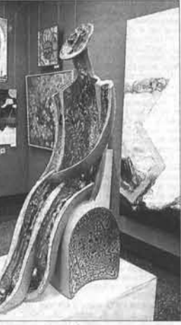
Специалисты родеут большое количество скульптуры и произведений декоративно-прикладного искусства.

работ, которые экспонируются уже на трех площадках, мы будем поддерживать этот проект, – пообещал вице-губернатор.