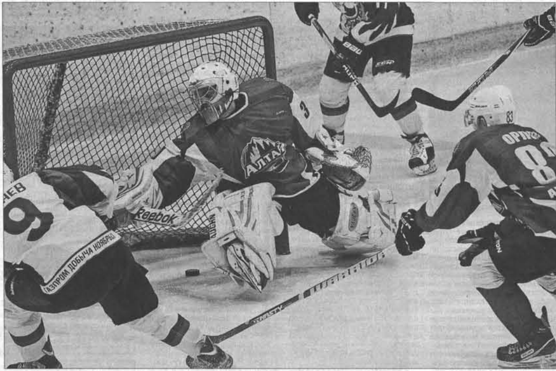
Гости забивают победную шайбу в овертайме.

«Ямальские Стерхи» могли размотать счет уже в середине стартового периода, когда был сбит их игрок, рванувший