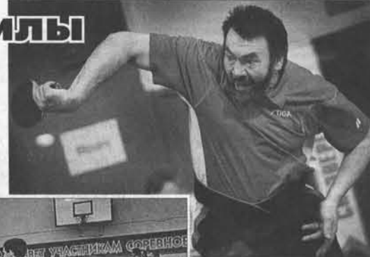
Подвиги ветеранов были полны азарта и агрессии.