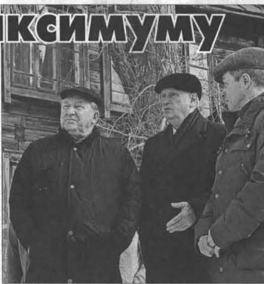
Губернатор Александр Карлин и глава администрации Барнаула Игорь Савинцев ознакомились с мерами подготовки Затона к встрече со стихией.