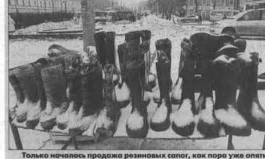
Только началось продажа резиновых сапог, как пора уже опять достать валенки.

Анекдот в тему – Почему падает температура, когда выпадает снег? – Потому что скользко!