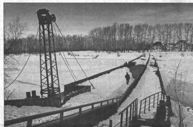
Когда река выйдет из берегов, а также в случае затопления дорог в Барнауле жители Затона будут добираться речным транспортом. Договоры с организациями уже заключены.

Группа по взаимодействию со СМИ Отделения ПФР по Алтайскому краю.