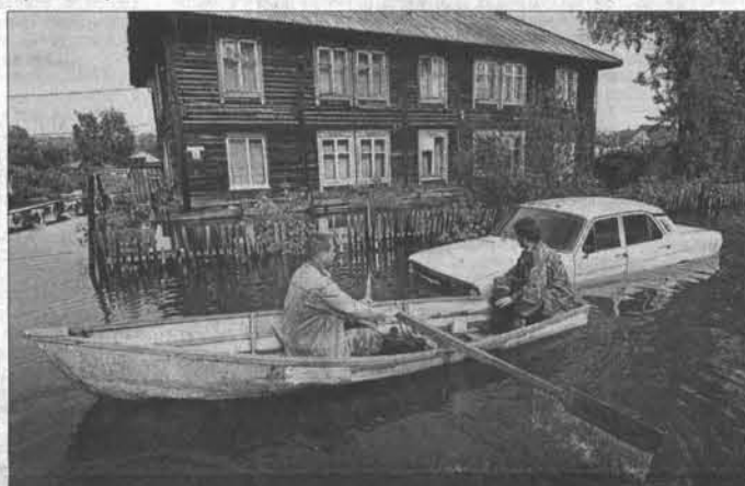
А таким был Затон в 2010 году.

ка, когда поднимется уровень воды в Оби выше критических отметок. Тема подготовки к паводку стала центральной на прошедшем 2 апреля в Затоне совещании с участием губернатора Александра Карлина, главы администрации Барнаула Игоря Савинцева, представителей управления по делам ГО и ЧС. Затон в этом смысле – традиционно проблемная для города и края территория, – сказал губернатор. – Каждый год здесь происходит подтопление, но все зависит от уровня подъема воды. Мы должны проверить нашу готов-