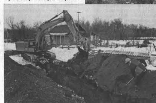
Работы в селе в самом разгаре.

Газификация района началась в 2012 году с вводом в эксплуатацию газораспределительных станций в селах Березовка и Усть-Иша. Сейчас проложена почти 9 километров газопроводов, газифицированы котельная медико-санитарной части ГУВД по Алтайскому краю в поселке Мост Иша и несколько частных домов. Заместитель главы администрации Красногорского района