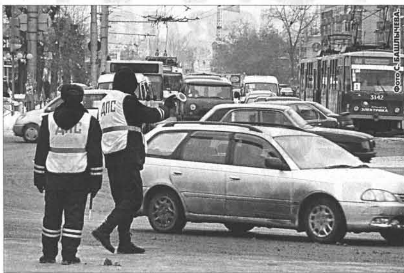
Городские магистрали - проблемная зона.

К сожалению, нам не удалось предотвратить семь трагедий в Заринском, Троишском,