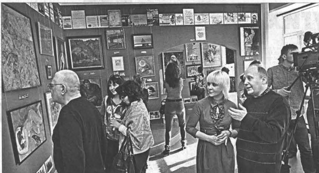
Кураторы павильона хотели, чтобы главным экспертом в области современного искусства стал именно зритель. Похоже, им это удалось!

Ведь все десять лет своей жизни павильон умудрялся продемонстрировать самое свободное, яркое и необычное искусство. В этом ряду – смелые фотографии и арт-объекты, румынские иконы на стекле, современная японская гравюра, разнообразная живопись, скульптура и графика. Еще здесь мож-