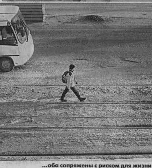
...оба сопряжены с риском для жизни.

А ведь скорого таяния великих снегов под мостом ждать не приходится - он настолько смерзся, что впрямь разбивать его отбойными молотками. Что же, будем ждать, когда прогреет гром? Нет, не тот первый, в начале мая, а другой - после которого мужик обычно крестится... Очень бы хотелось верить, что никакие ЧП под мостом не случится. И службы, на чей совести лежит ответственность за эти территории - дорожники ли, железнодорожники или мостовики, - все сделают, чтобы этот путь под мостом не стал для кого-то последним.