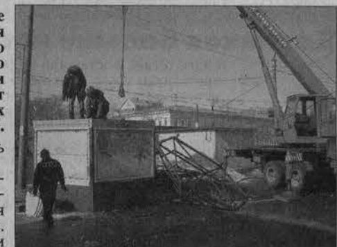
Идет демонтаж торговых киосков.

В Барнауле завершаются работы по освобождению площади Спартака от временных сооружений.