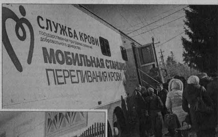
СЛУЖБА КРОВИ Государственная программа «Мобильная станция переливания крови»

Состояние здоровья жителей оценивают высококвалифицированные специалисты: терапевты, врачи узких специальностей - кардиологи, офтальмологи, эндокринологи, неврологи,