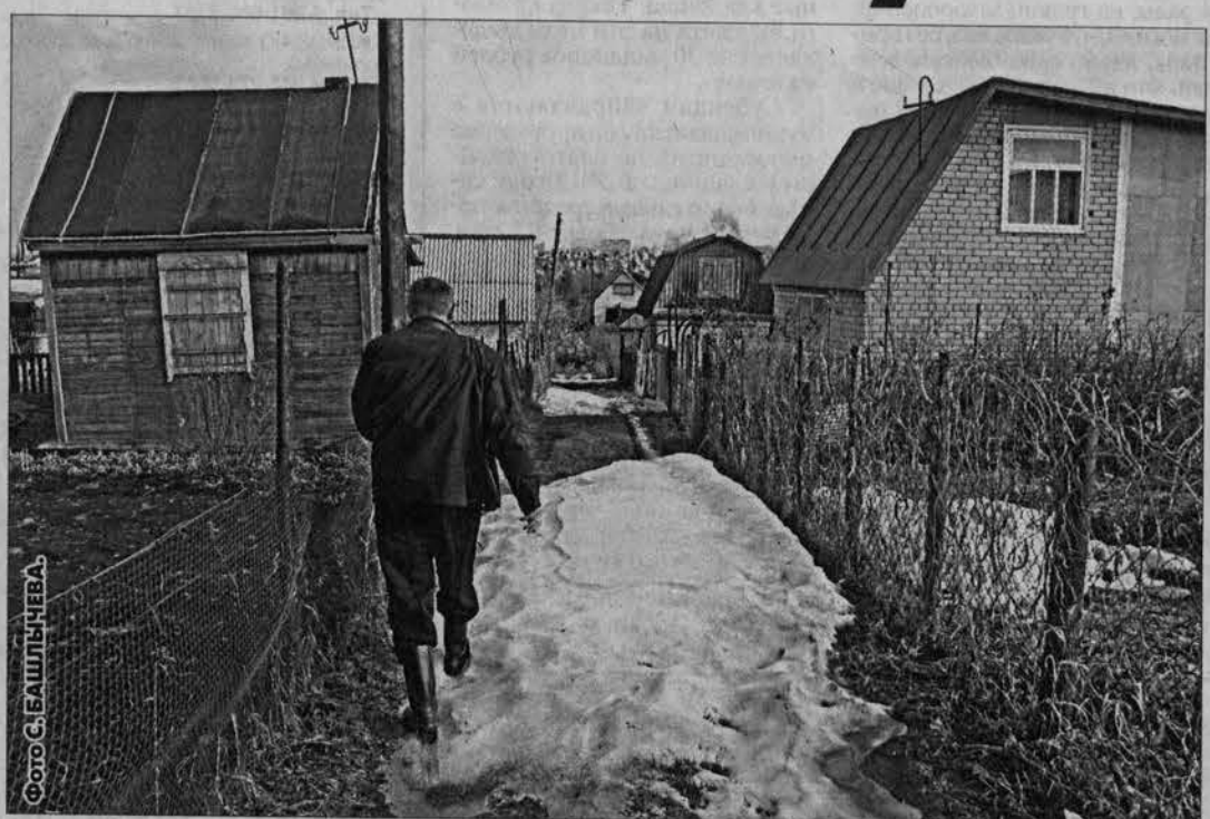
Пора браться за лопату...