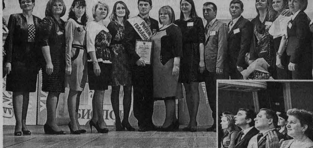
На сцене — участники очного этапа конкурса «Учитель года Алтая — 2013».

Такие кадры нам нужно беречь и поддерживать. Именно этому и способствует наш традиционный, уникальный в своем роде конкурс «Учитель года Алтая»: он с самого начала был направлен на выявление талантливых педагогов и повышение престижа учительской профессии. Изменилась миссия победителя, который в течение всего года передает собственный опыт, в том числе во время выездных мероприятий в сельские районы.