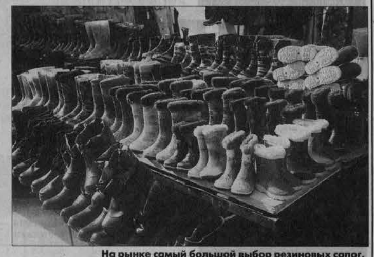
На рынке самый большой выбор резиновых сапог, и цены не кусаются.