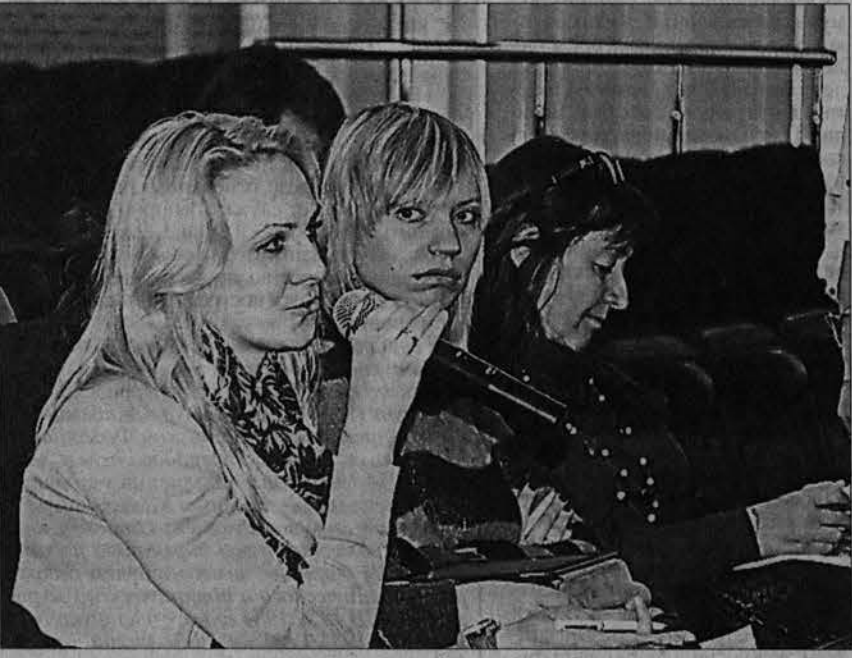
Журналистов интересовала не только выставка «Интурмаркет», но и туристические возможности Алтайского края.

Об этом заявил губернатор Александр Карлин во время состоявшейся в Москве пресс-конференции, посвященной Международной туристической выставке «Интурмаркет». Она будет работать в столице 16-19 марта. Алтайский край – стратегический партнер выставки. Туристические возможности региона представят более 50 экспонентов: муниципальные образования, туристические фирмы, санаторно-курортные учреждения, гостиничные предприятия и другие организации.