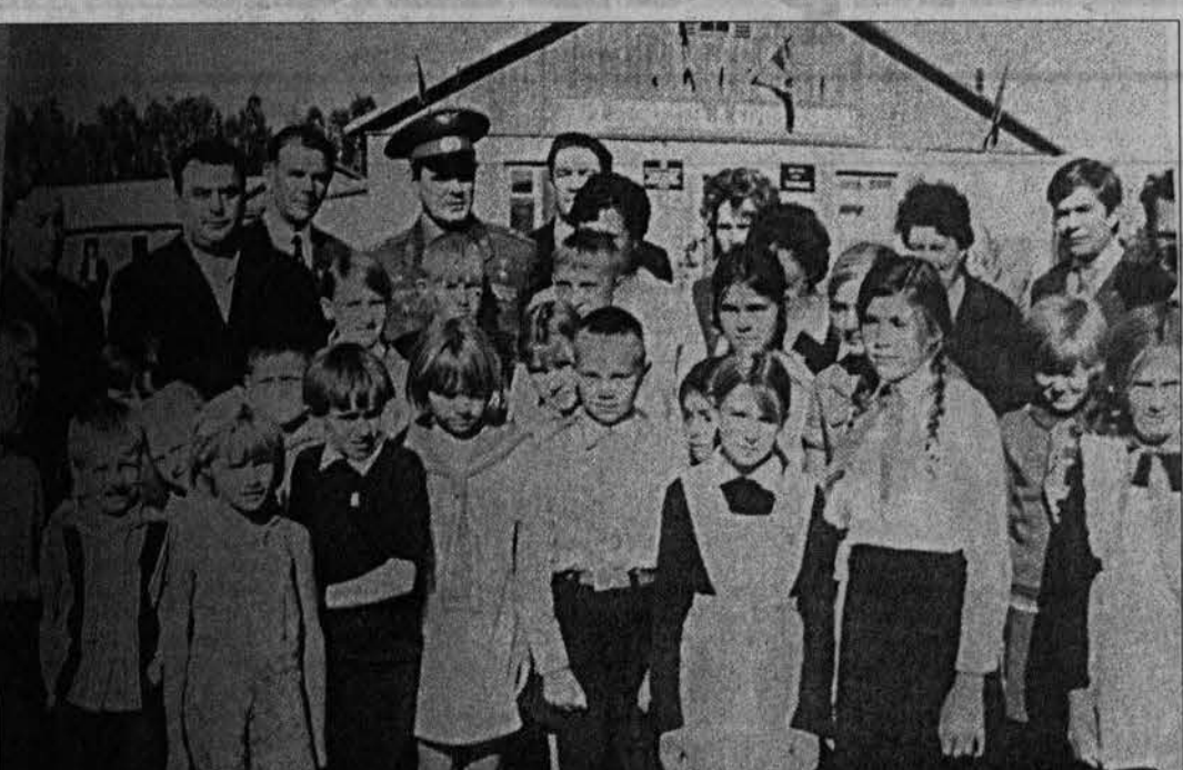
Василий Лазарев на встрече с порошинскими школьниками в 1974 году.