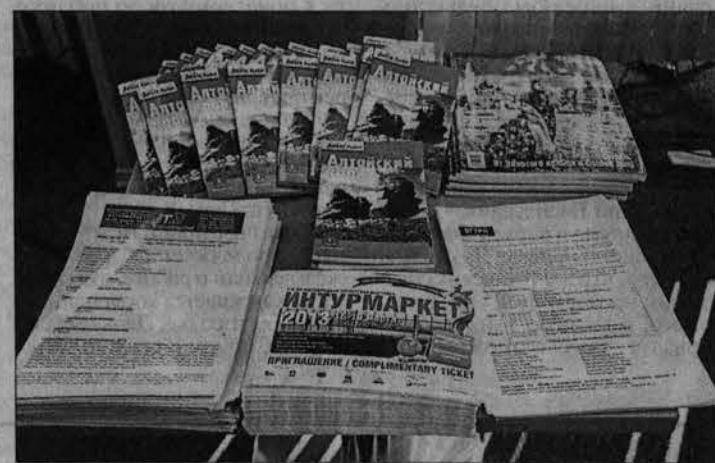
В центре на снимке – новое туристическое издание. Это путеводитель по Алтайскому краю.