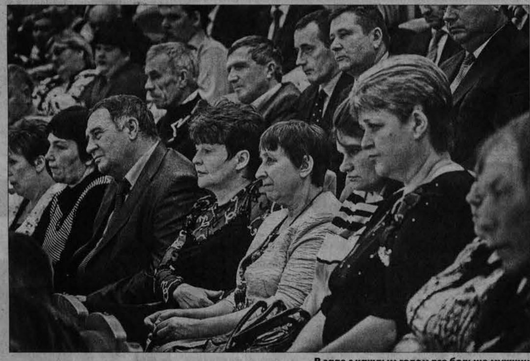
В зале с каждым годом все больше мужчин.