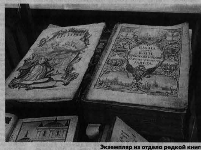
Экземпляр из отдела редкой книги.

– Я думаю, вы совершенно правильно решили отметить этот день, потому что даже в далеком 1888 году горожане нашли воз-