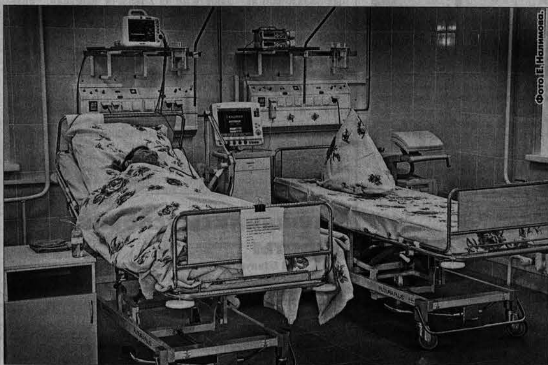
Операция на сердце прошла успешно. Прогноз на будущее - благоприятный.