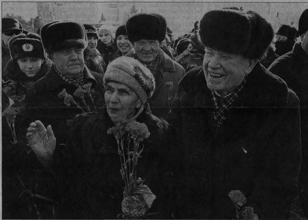
Для ветеранов 23 февраля - праздник воспоминаний.