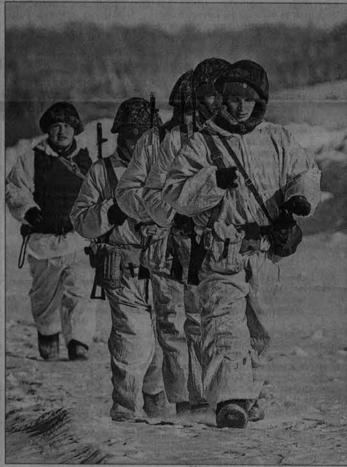
Учения на стрельбище дивизии.