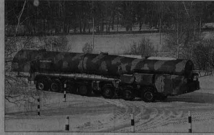
Этот учебный "МАЗ" - точная копия пусковой установки "Тополь".