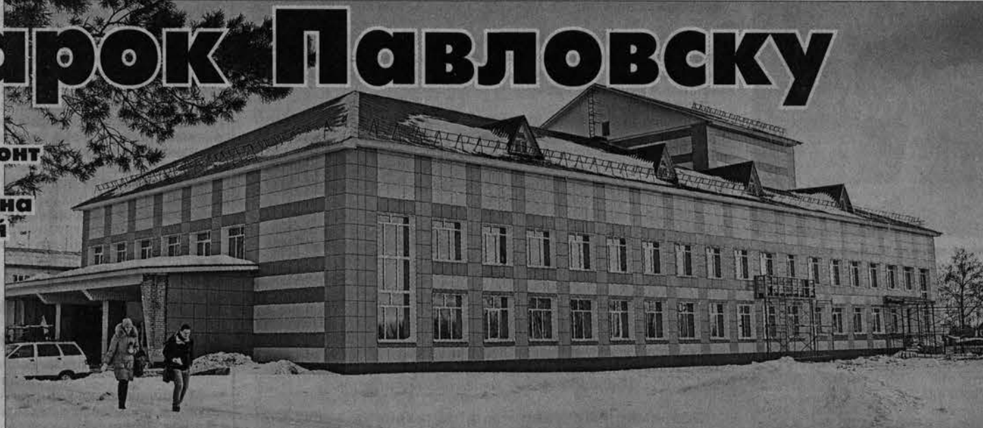
Обновленный клуб скоро распахнет свои двери.

Для тех, кто был в ДК «Юность» еще в прошлом году, перемены разительны. Чистое, светлое фойе, новые классы, сияющий зрительный зал (правда, пока еще без кресел). Все это - результат реализации краевой программы «75х75».