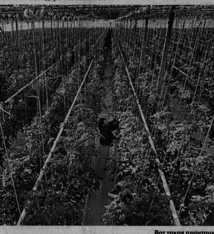
Вот такая плантация!

Справка «АП» Предприятие «Индустриальный» образовано в 1983 году. Тепличный комплекс с площадью защищенного грунта занимает 26,15 га. Сегодня здесь трудятся 738 человек.